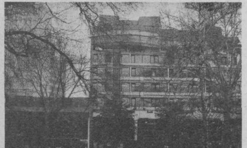
Pročelje Cankarjevega doma ni več zakrito z gradbenimi odri; takšna je njegova podoba s severne strani