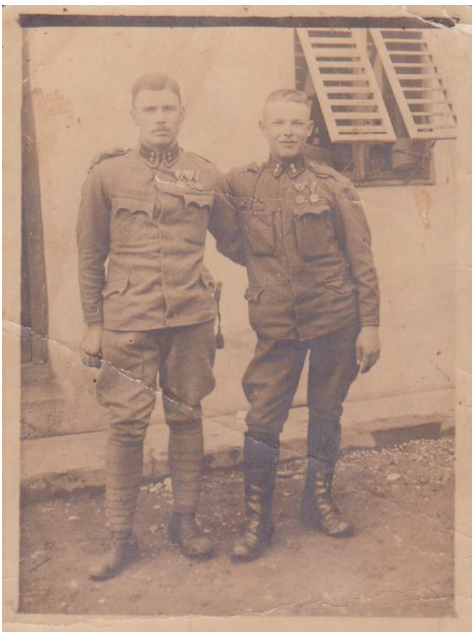
Nekje v zaledju, leta 1917.