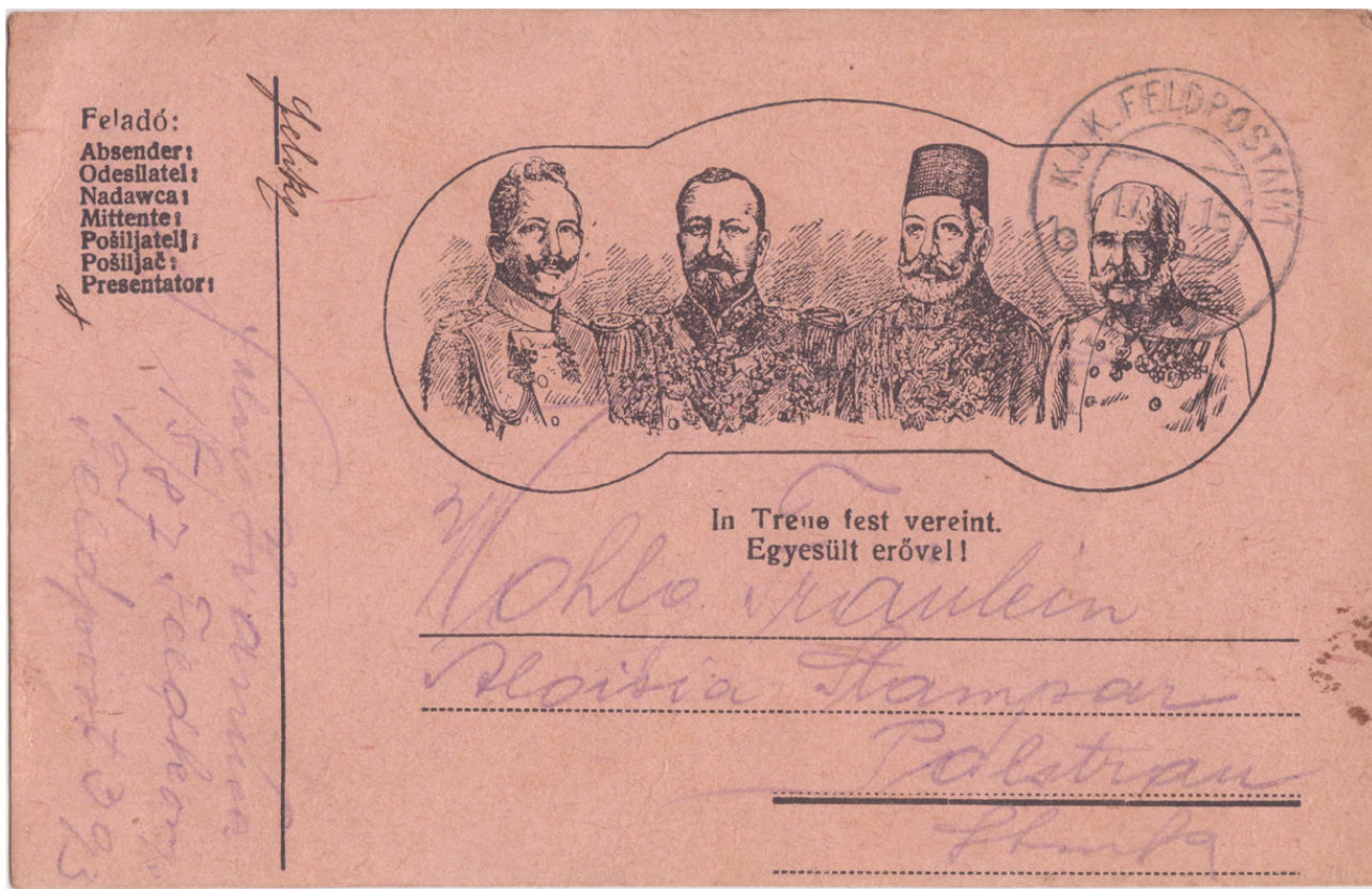
Propagandna dopisnica z voditelji centralnih sil.