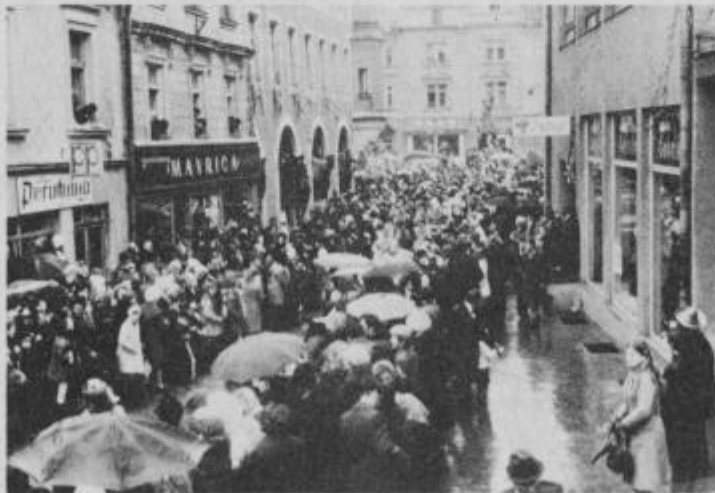
Ulice Ptuja so obiskovalci izpolnili do zadnjega kotička