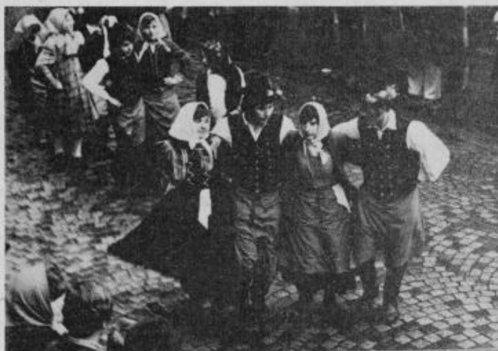
Nastop folkloristov iz Cirkovc v dopoldanskem programu

Pustni torek v Ptujju izumira, kajti glavni pustni dan je že več let pustna in karnevalska nedelja. Po neuradnih ocenah je bilo v Ptujju v času karnevala 40 do 50 tisoč obiskovalcev, kar je zelo razveseljiva številka za organizatorja. Prireditev je kljub nagajanju vremena uspela.