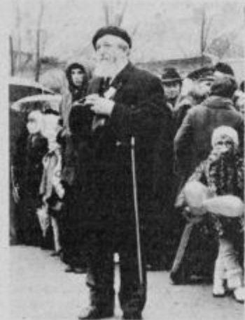
Božidar Jakac kljub letom ni zaostajal za mladimi novinarji in kamerami

Tolažilno nagrado je dobila tudi manjša skupina iz Gorišnice 100 din. Skupina osnovne šole Petrijanec, v kateri je nastopilo 182 učencev in dijakov, je bila najučinkovitejša, vendar ni bila nagrajena glede na dogovor o povračilu stroškov od prireditelja.