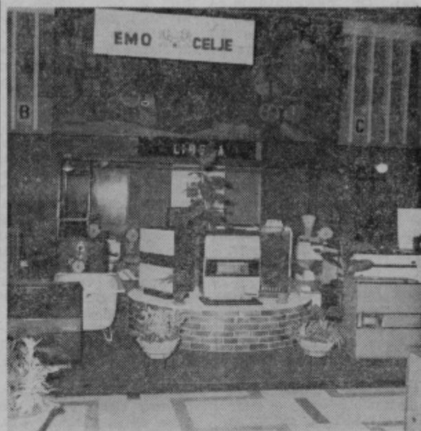
Del izdelkov, razstavljenih na mednarodnem salonu gospodinjstkih aparatov v Beogradu od 11. do 21. oktobra.

Na tretjem mednarodnem salonu gospodinjstkih aparatov v Beogradu je svoje izdelke razstavljala tudi EMO. Udeležili so se številni domači in tuji proizvajalci, med katerimi so izdelki EMO zbudili lepo zanimanje. Razstavili so nove EMOTERM kotle, potrošniki pa so se zanimali tudi za nove panelne radiatorje. Iz zvrsti emajlirane posode so obiskovalci povedali veliko pohvalnih besed na račun različnih garnitur posod, predvsem pa jim je bila všeč Special posoda — z bakelitnimi ročaji. Take ročaje imajo tudi različni tipi aluminijastih pekačev, kar jim lepša videnje in povečuje praktičnost.