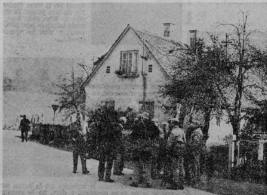
Na Ostrožnem so bili pripravljeni vsi: ljudje in avtomobili.

»Vojna reporterja« MILAN SENICAR TONE VRABL