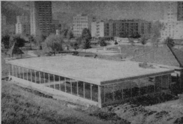
Velenjčani dograjujejo svoj zimski bazen. Kot zatrjujejo, ga bodo predali uporabnikom - Velenjčanom in okoličanom - že letos novembra, seveda, če jim bo tuji partner pravočasno zagotovil plastično korito. Kasneje bodo dogradili še večji plavalni bazen na odprtem, poskrbeli pa bodo tudi za parkirni prostor in ostale objekte, ki sodijo poleg.