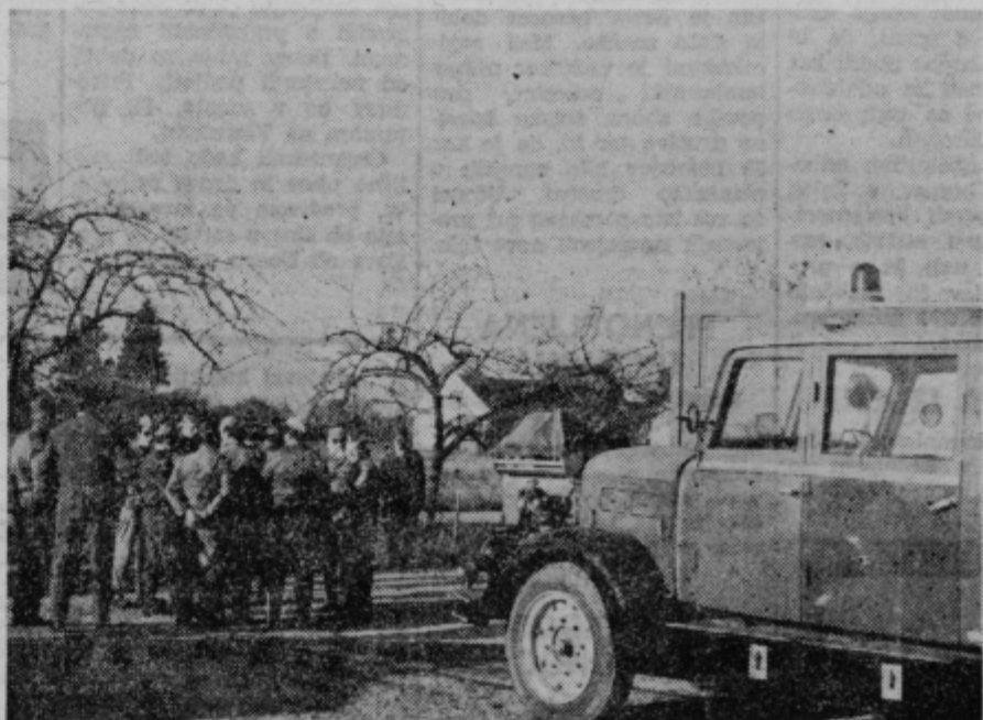
Četa sanitete pred Dolгим poljem tik pred letalskim napadom.