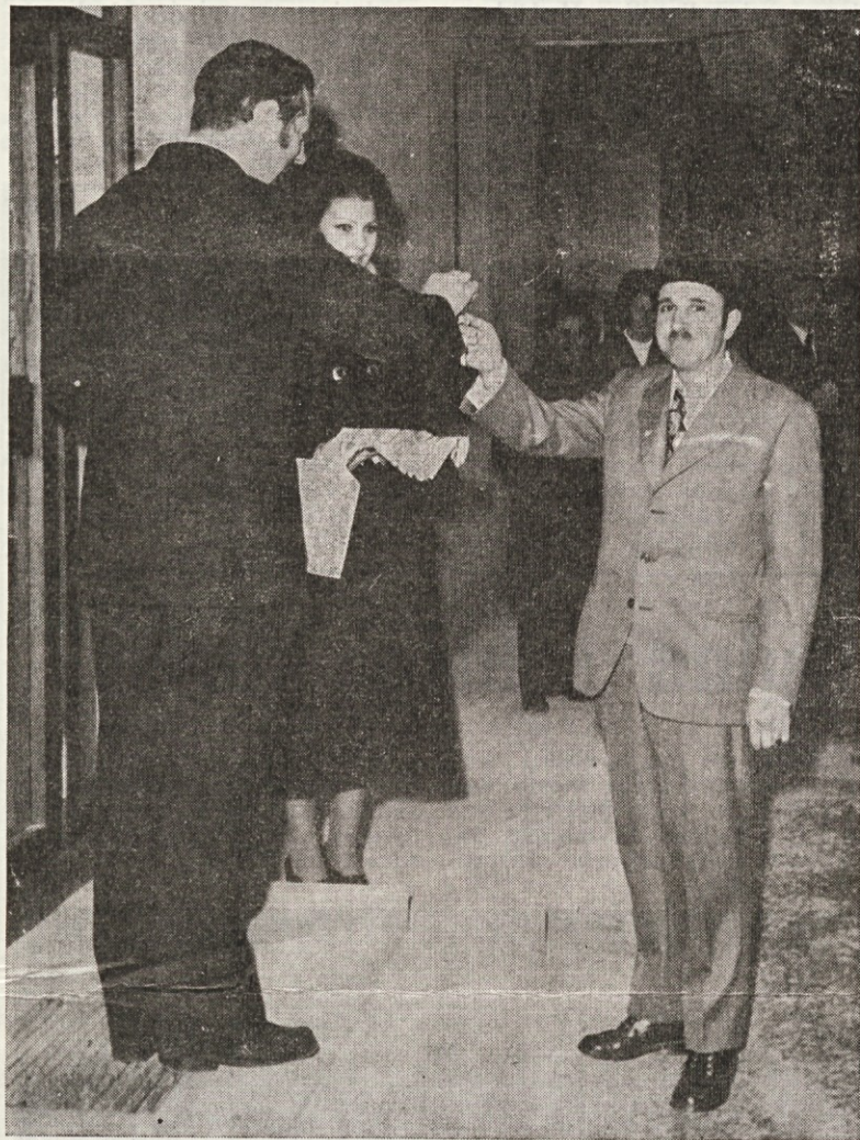
Vodja prodaje izroča ključ poslovdji ob otvoritvi preurejene trgovine.

71.457,05 din 4.350,— din 8.069,95 din 14.495,10 din 9.698,20 din 20.268,65 din 4.917,25 din 4.693,50 din 2.250,— din 1.617,40 din 1.620,— din 500,— din 420,— din 3.639,85 din 270,— din 488,— din 1.336,15 din 461,90 din 200,— din 631,75 din 153,20 din 32.879,65 din 184.407,60 din 1.743,10 din 17.038,42 din 18.781,52 din