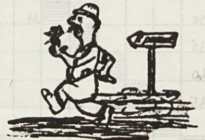
Šarc Terezija iz DE 13 — na poti na delo. Gladek Marjan iz DE 13 — obratna nezgoda.