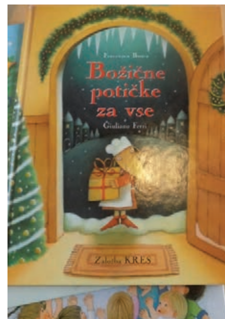
Slika 2: Božične potičke za vse