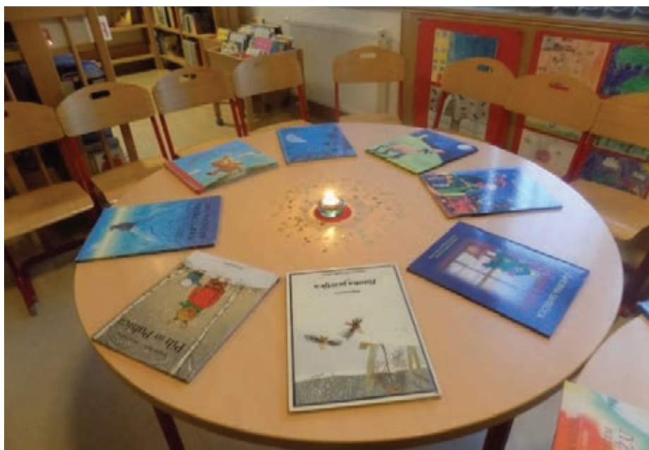
Slika 1: Prijetno vzdušje v šolski knjižnici

prijetni svetlobi in vonju dišečih svečk prisluhnili dvema sodobnima pravlji-