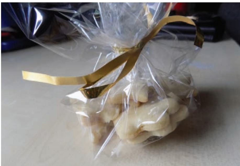
Slika 5: Piškote smo zavili in odnesli domov kot darilo.

do knjižnice in njenega gradiva, s posebnim poudarkom na vzgoji za knjigo, motivaciji za branje in estetskem doživljanju. Učenci z uporabo knjižničnega gradiva tudi spoznavajo različne probleme in strategije reševanja le-teh ter razvijajo komunikacijske spretnosti. In nenazadnje, dogodek sledi ciljem, ki jih opredeljuje Zakon o osnovni šoli (Vir 2): vzpodbujanje skladnega spoznavnega, čustvenega, duhovnega in socialnega razvoja posameznika, vzgajanje za medsebojno strpnost, spoštovanje drugačnosti in sodelova-