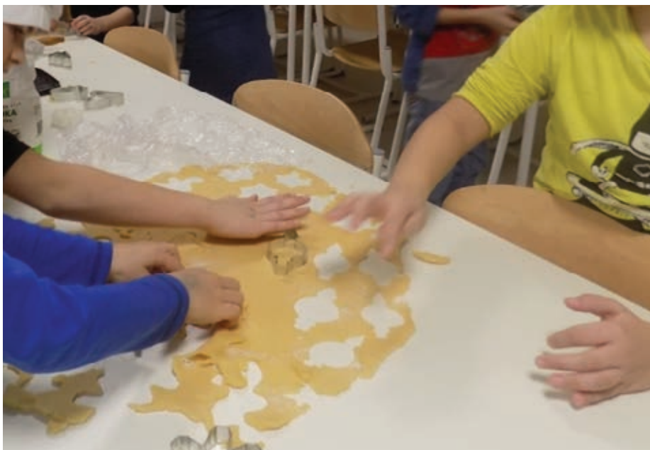
Slika 4: Pekli smo piškote.

Ko so bili piškoti pečeni, so jih učenci previdno zložili v vrečke iz celofana. Skupaj z receptom iz knjige so jih odnesli domov, da so z njimi razveselili svoje starše, enako kakor je mišek Matiček s piškotki razveselil svojo mamico.