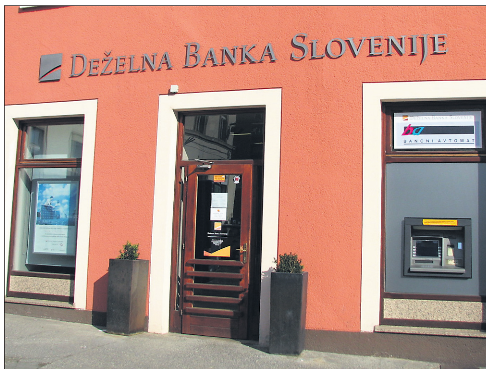
V DBS v kriznem obdobju niso zaznali padca najemov kreditov, sicer pa kmetje največ najemajo posojila za nakup mehanizacije in obnovo gospodarskih objektov, priljubljeni pa so tudi kratkoročni krediti, prilagojeni ciklom kmetijske proizvodnje.

Sicer pa v DBS kmetovalcem nudijo gotovinske in namenske kredite z ugodno obrestno mero za financiranje: osnovne dejavnosti, izgra-