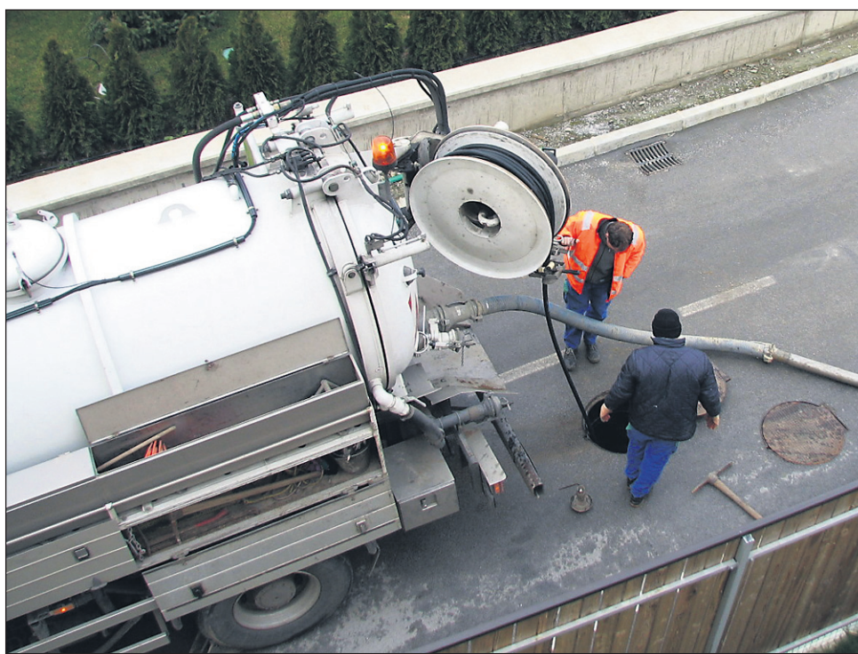
Po sprejetih odlokih za plačilo komunalnega prispevka je v občinah znesek priključnine na kanalizacijo zelo različen – recimo v Markovcih le 375 evrov, v sosednji Gorišnici pa že kar štirikrat večji.

V Vidmu so morali s pavšalnim prispevkom opravičiti hitro po sprejemu odloka, saj se je našlo kar nekaj dovolj nadebudnih občanov, ki so si hitro preračunali, da bodo po odloku plačali precej manj, kot je znašal pavšalni prispevek (1000 evrov). Po pritožbah je tako morala