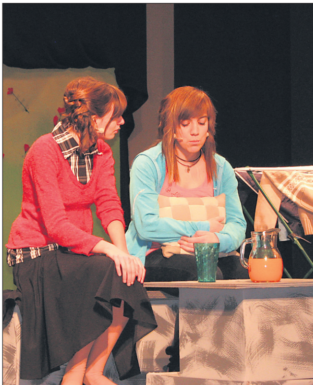
Žalostna zgodba Roža pod kamnom je marsikomu segla do srca.