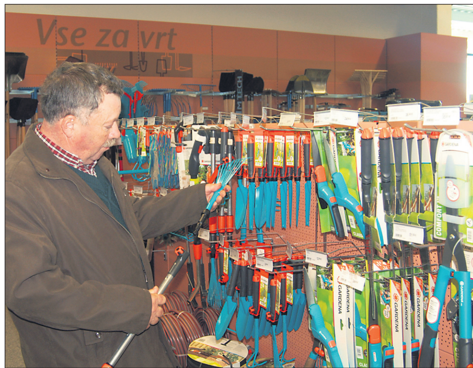
Osnovno orodje za obdelavo vrta so lopate, grablje, motike, grebači, prekopne vile ter razni pripomočki za sajenje in rahljanje zemlje.

Zalivalke : so za ljubiteljske vrtnarje že skoraj obvezne, kajti rastline potrebujejo za pravilno rast poleg zraka in sonca tudi vodo. Zato je poleg okopavanja in pravilnega gnojenja zalivanje eno najpomembnejših vrtnih opravil. Za manjše vrtove so najpriljubljenejše plastične zalivalke z volumnom 8 do 10 litrov. Zalivalke iz pocinkane kovine bodo sicer vzdržale dlje, a so tudi težje, zalivalke iz galvanizirane kovine pa bo kmalu napadla rja. Pomembno je, da so luknje na razpršilnem nastavku primerne velike, da ob zalivanju voda ne odteka prehitro ali prepočasno.