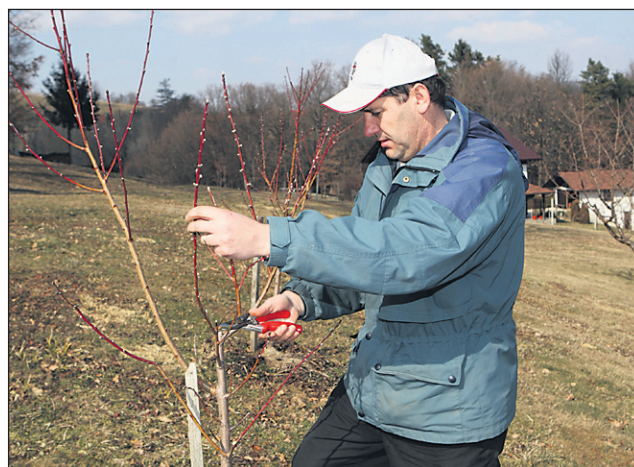
Osnovno načelo rezi je vzdrževanje rodnega lesa in vzgojne oblike.

poznajo rodnega lesa, režejo vse sadne vrste enako, kar je največja napaka. Tako moramo vedeti, da breskev rodi izključno na enoletnem lesu, zato jo moramo intenzivno rezati, da dobimo enoletni les. Jablana in hruška rodita na dvo- do triletnem lesu, rezati je treba tako, da dobi vzgojno obliko in zato ne smemo pustiti enoletnih poganjkov.