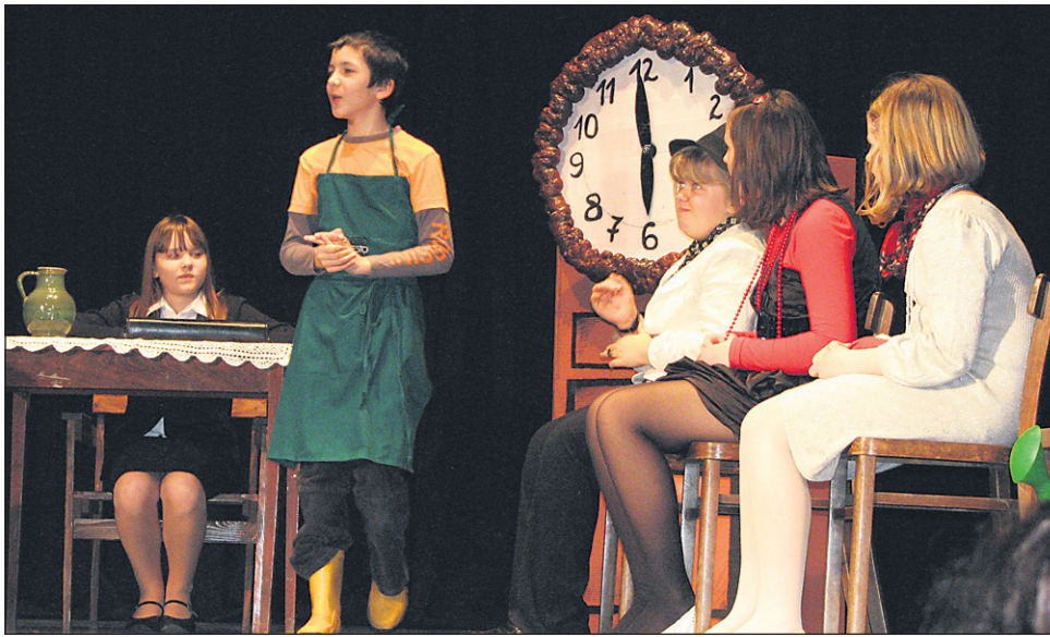
Srednja gledališka skupina OŠ Ormož je uprizorila igro Poslednja želja Rozalije M., za isto besedilo so se odločili tudi člani Gledališke skupine Zverinice iz OŠ Sv. Tomaž.