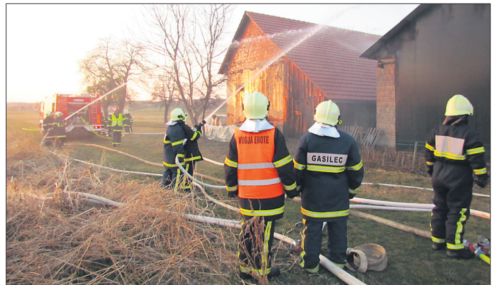
Operativne gasilke v akciji