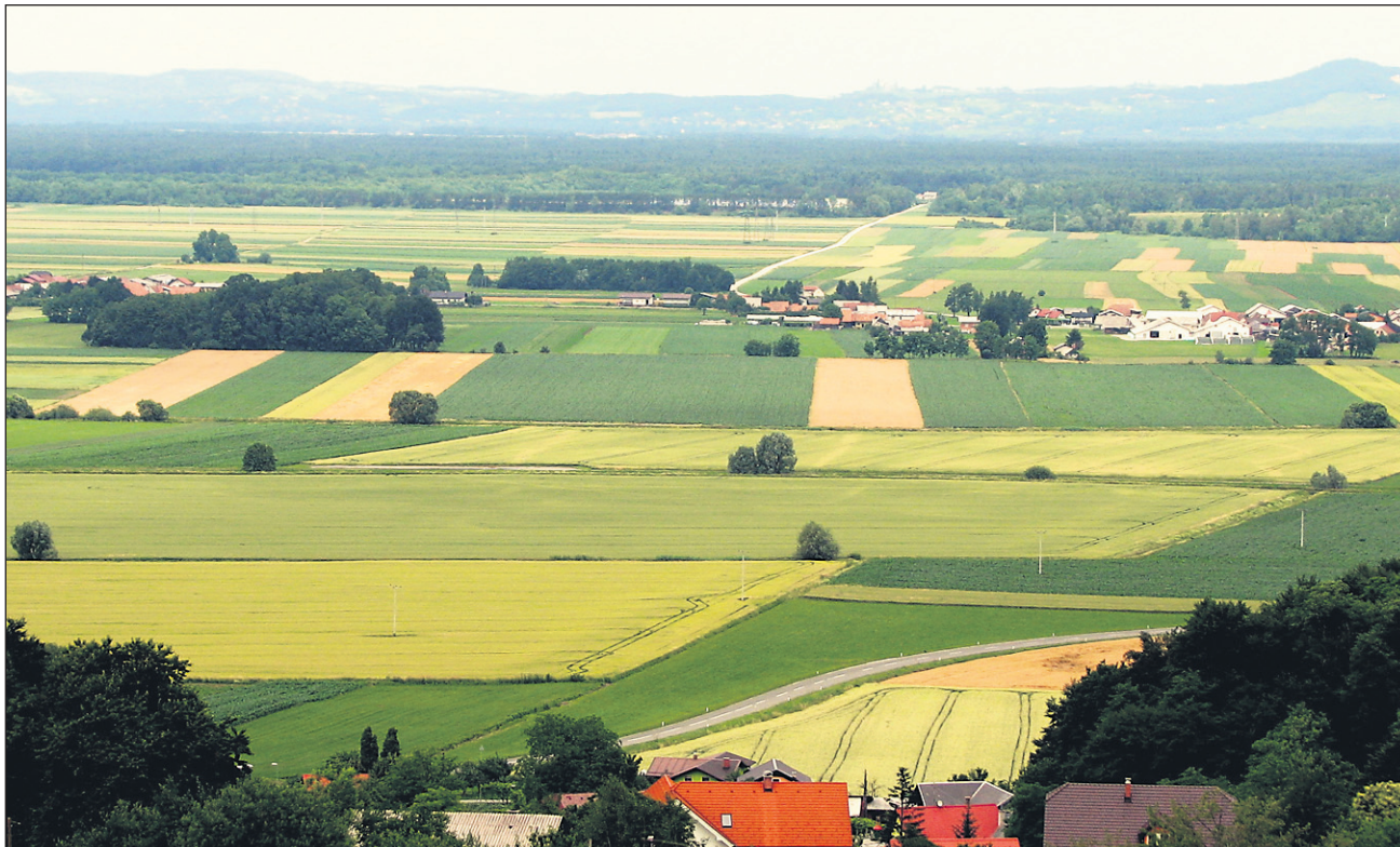
Kolobarjenje je danes skoraj že nuja, saj se tako ohranja boljša kakovost zemlje, zmanjšuje se nevarnost širjenja pleveli in bolezni, posledično se porabi manj gnojil in fitofarmaceutskih sredstev, kar pomeni, da se s kolobarjenjem lahko tudi kar veliko prihrani.

Kolobarjenje pomeni menjavo kultur na poljedelskih ali vrtnih površinah. Že skozi stoletja so ljudje spoznali, da če imajo isto kulturo na isti njivi več let, ta črpa iz zemlje vedno iste hranilne snovi, razvijajo se iste vrste pleveli, ki se jih vedno težje uničuje, korenine teh rastlin izločajo nekatere toksine, ki nato zavirajo rast v naslednjem letu, največja težava pa so bolezni, ki se praviloma prenašajo z rastlinskih ostankov na njivi na zasajeno kulturo naslednje leto.