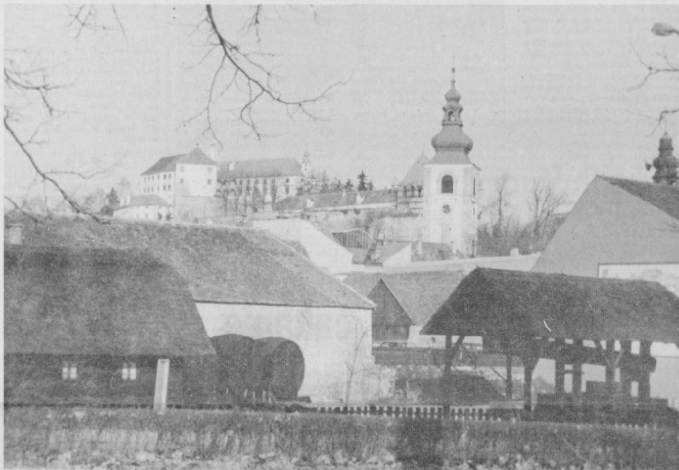
ŽLAHTNO SOŽITJE LEPOTE