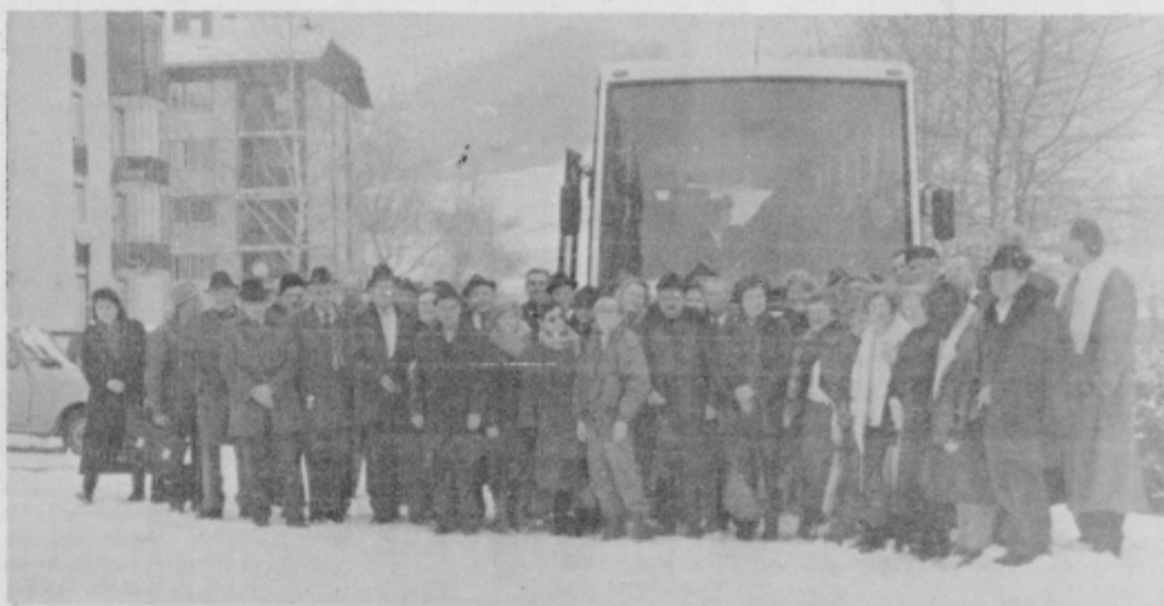
Udeleženci izleta v Zrečah.