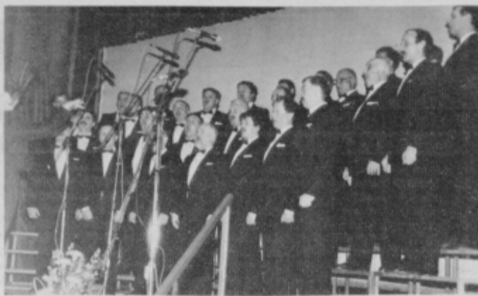
Koroški Vresovci so ogreli dlani ljubiteljev petja.