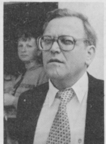
Večni iskalec lepote, borec za to, da bi vse, kar je naše, slovensko, ohranjali poznejšim rodovom...

Poklicno se je s kulturo pričel ukvarjati pred štirinajstimi leti kot sekretar KUS občine Slovenska Bistrica, sedaj pa je strokovni delavec pri bistrški ZKO. Problemi, ki jih na tem področju ni malo, so mu znani do vseh potankosti. Natanko ve, kje so ostanki naše kulturne in zgodovinske dediščine, ki jih je potrebno ohraniti za prihodnje rodove. Pri svojem prizadevanju je velikokrat naletel na ovire, ki so mu jih postavljali številni bodisi zaradi neznanja, zavisti ali pa kdo ve zaradi česa vsega, v preteklosti pa tudi zaradi čudne miselnosti, da je kultura »sama poraba«, ne pa nalozba v narod in njegovo ohranjanje. Rad pove, da ravno skozi kulturo narodne korenine poganjajo na novo.