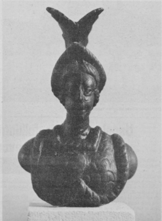
Rimski boginji Minervi je enaka grška Atena, ki so jo ponavadi upodabljali v bojni opravi. Tako je prikazana tudi v drobni bronasti plastiki, ki jo hrani ptujski muzej.

Pokrajinski muzej Ptuj hrani v zbirki drobnega arheološkega gradiva bronasto plastiko Atene / Minerve.