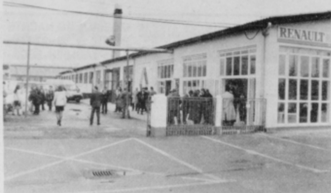
Nov prodajno-servisni salon Renaultovih vozil ob Ormoški cesti, kjer so razstavljena tudi njihova vozila.