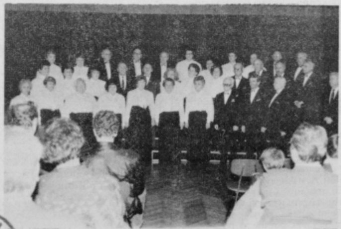
Mešani pevski zbor upokojujencv Delavskega prosvetnega društva Svoboda Ptuj