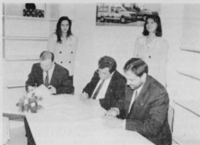
Slovesen trenutek ob podpisu pogodbe v prostorih novega Renaultovega servisa.