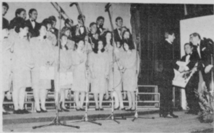
Goriški pevci so ob jubileju prejeli čestitke in spominska darila sopevcev.