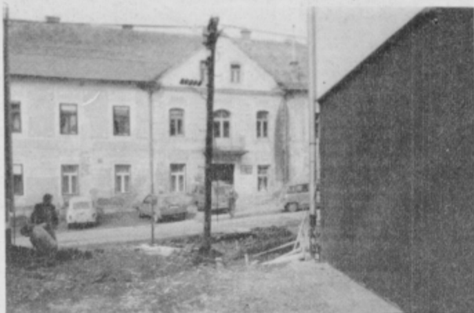
Drog, katerega prestavitev stane najmanj 50 tisočakov.

CIRKULANE: Večnamensko dvorano bodo v začetku marca že začeli uporabljati, vendar bo svečana otvoritev šele ob krajevnem prazniku, ki ga praznujejo v juniju. V dvorani bo poleg telovadnice še nekaj prostorov za mlade in upokojece ter delovanje drugih društev.