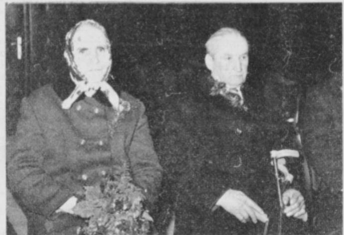
Zlatoporočenca med svojimi bližnjimi na slovesnosti.

12. 1911 v Placarju, je delala doma in gospodinjala. Poročila sta se 16. 2. 1942 v Koreni. Kljub temu da nista imela svojih otrok, na jesen svojega življenja nista ostala sama.