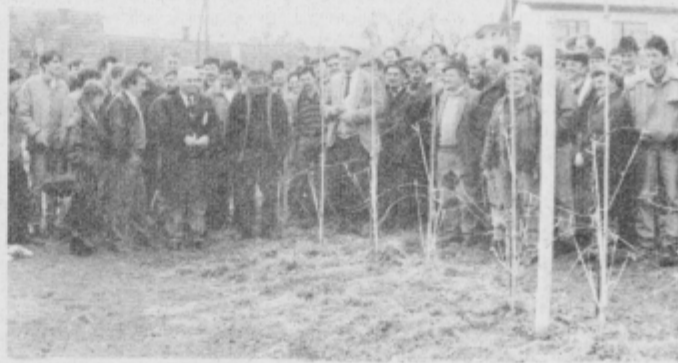
Tako množična je bila udeležba v sadovnjaku pri Šilčevih. Posnetek (jos)