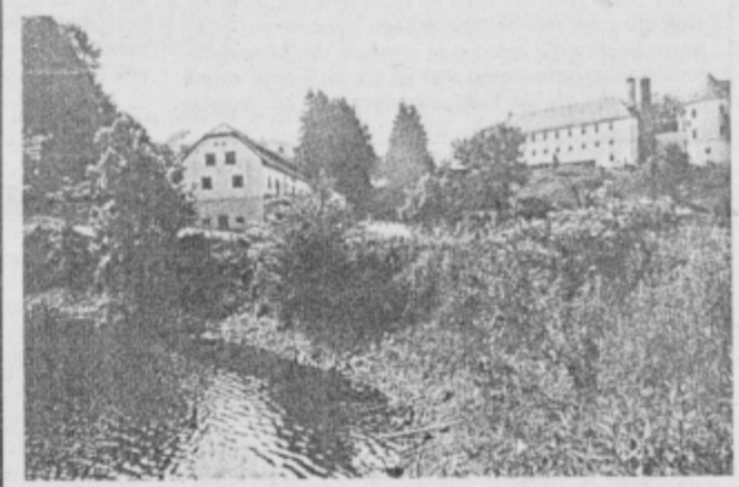
Priča mračnih dogodkov maja 1945.