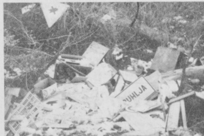
Spuhlja na smetišču.

PRI ROKU: Že na sami tabli pri smetišču ob Roku piše, da je tja dovoljeno voziti le odpadni gradbeni material in zemljo. Pa vendar ptujsko Cestno podjetje tega ne upošteva. Dokaz vidite na sliki.