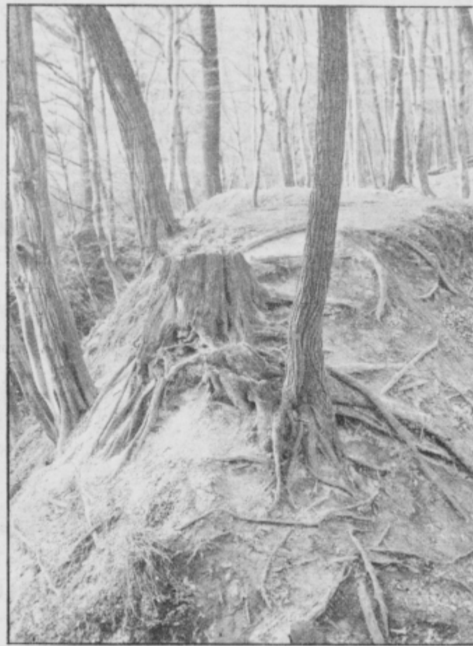
V Ljudskem vrtu