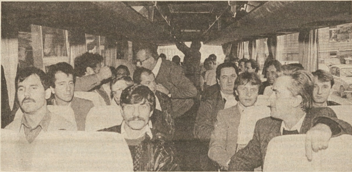
Vsi smo na istem vlaku...