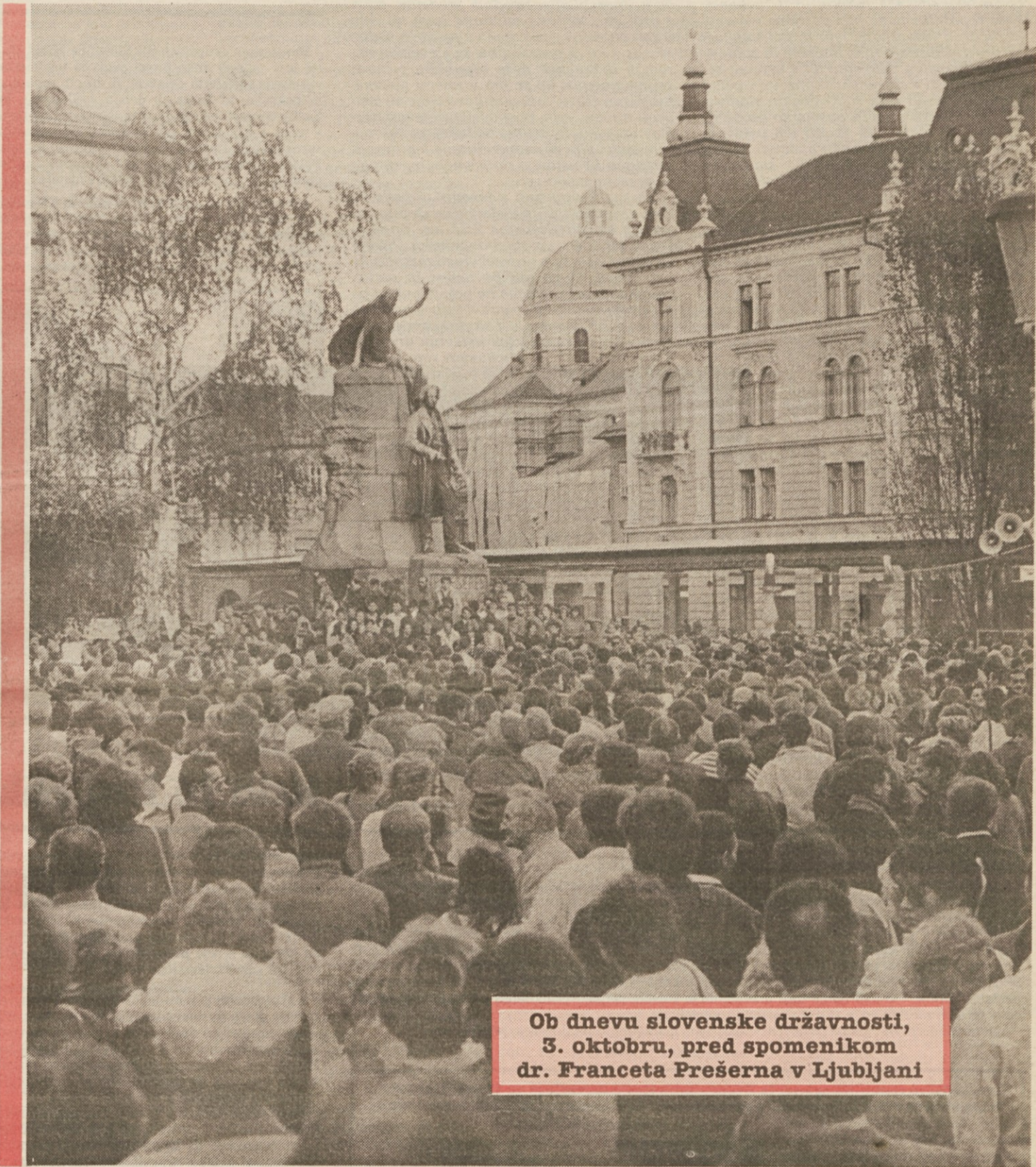
Ob dnevu slovenske državnosti, 3. oktobru, pred spomenikom dr. Franceta Prešerna v Ljubljani

Brbrarije postajajo tudi v sindikatih vse bolj moreče. Ekstenzivna razprava, ki smo ji bili priče tudi na minuli seji predsedstva, s polno ponavljanja, vendar brez vsake spremembe v listini, ki ji pravimo program neodvisnih sindikatov Slovenije, je pokazala tudi na nedojemljivost posameznikov za novo, pa naj gre za velike spremembe v družbi ali za takšne v sindikatih. Nizki udarci z besedami, če parafraziramo, da sestavljajo program ti-