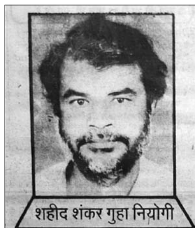
Shankar Guha Niyogi

Shankar Guha Niyogi pa je najbolj prodorno ime za ljudska srca po neodvisnosti. Komaj polnoleten se je iz Bengalije preselil v Bhilai, kjer je kot stotine drugih izobraženih mladeničev videl možnost zaposlitve v jeklarni. Po diplomu sredi šestdesetih let se je tudi zaposlil ter bil sekretar sindikata Blast Furnace Action Committee. V nadaljnjih nekaj letih je bil član Koordinacije komiteja revolucionarnih komunistov, preden so se preimenovali v Komunistično stranko Indije – Marxisti–Leninisti (KSI–M–L), vendar jo je v nekaj letih zapustil, saj v njej ni videl emancipatornih metod za razreševanje in preseganje ljudskih problematik. S tem pa je izgubil tudi zaposlitev ter se nato skoraj deset let kot nomadski delavec preizkušal in učil med prostranimi staroselskimi kulturnimi entitetami sedanje države Čatisgarh. Vključeval se je v lokalne boje in soorganiziral boje s staroselci v gozdovih Bastarja, z lovci in prodajalci rib v Durgu, kmetijskimi delavci v Keri Jungata, pastirji koz v Rajnandgaon, v mobilizacije za vodni zbiralnik v Rajnandgaon, v ljudske boje za vodo v Daihand itn. Leta 1977 se je preselil v Dalli Rajhara, kjer so ga zaradi odmevnih upiranj in samoorganiziranja delavcev povabili za predsednika prvega alternativnega sindikata rudniških delavcev Chattisgarh mines shra-