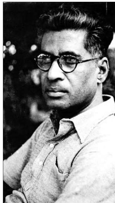
Manabendra Nath Roy