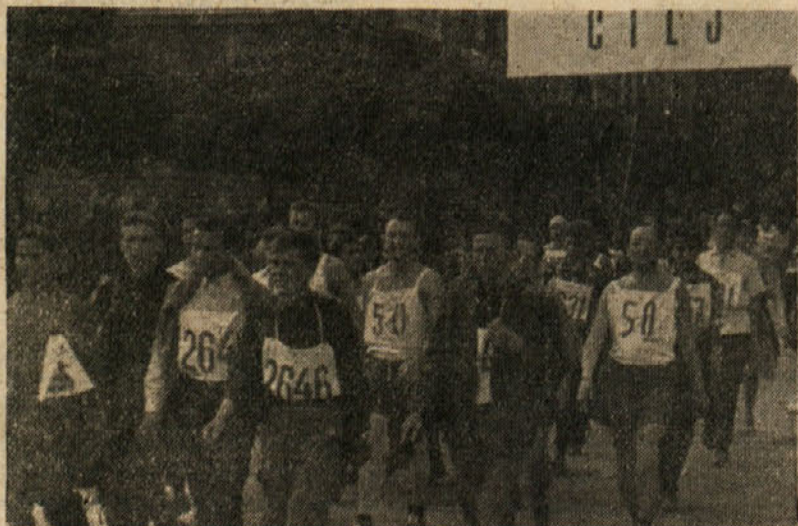
S pohoda Ob žici okupirane Ljubljane