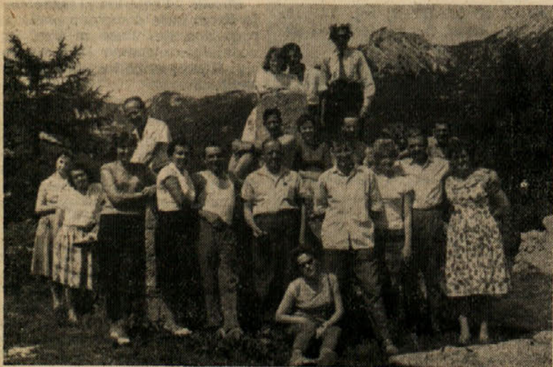
Iz izleta enega izmed sindikalnih pododborov kolektiva »Ingrad«

»Petstotisoč frankov«, je odgovoril Matissu.