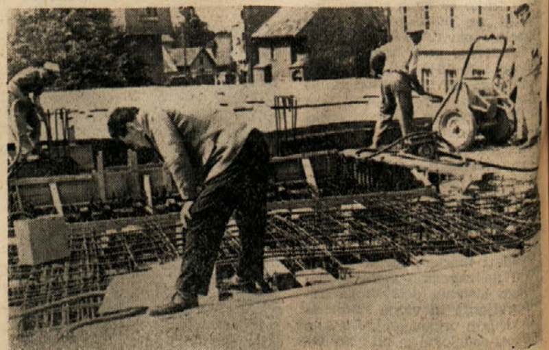
Študij načrta na samem objektu, uspešna oblika dela