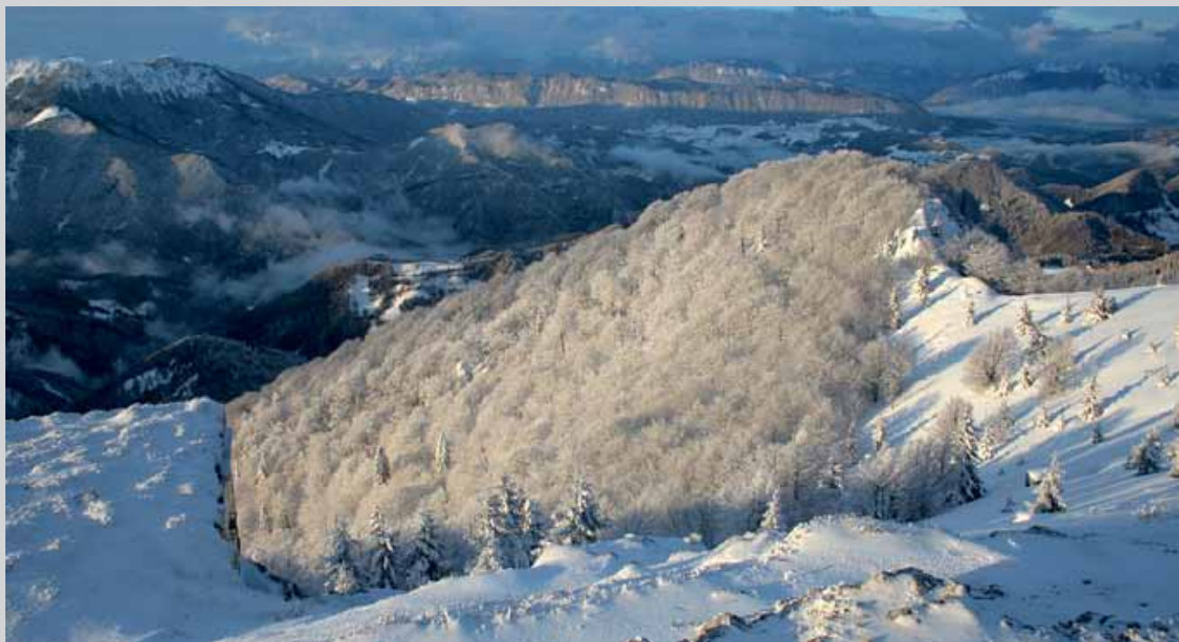
Razgled z Blegoša FOTO: JAKA ORTAR

Naj bo ta zapis tudi priložnostna vest o ponovoletnem pohodu na Blegoš. Zmeraj je 2. januarja, pohodniki se zberejo ob osmi uri pred stavbo Marmorja na Hotavljah v Poljanski dolini. Že več kot desetkrat je bil. Seveda pa je lepa tudi ta pritajena skrb za tisto, kar ni lastnina dotičnega. Kanček prijaznega skupnostnega planinskega čutenja tiči v njej. ●