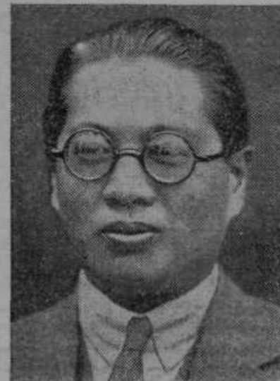
T. V. Soong, vodja kitajskih bančnih podjetij. Soong je za maršalom Čangkajšekom najmočnejša osebnost na Kitajskem.