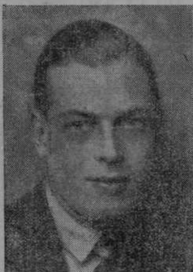
Vojvoda Kentski, brat angleškega kralja, bo obhajal 20. decembra 35 letnico.