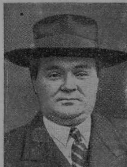
Henrik Spaak, belgijski zunanji minister.