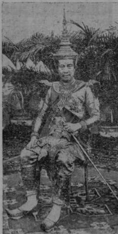
Kralj francoske indijske pokrajine Kambodscha v svečani kraljevski obleki.