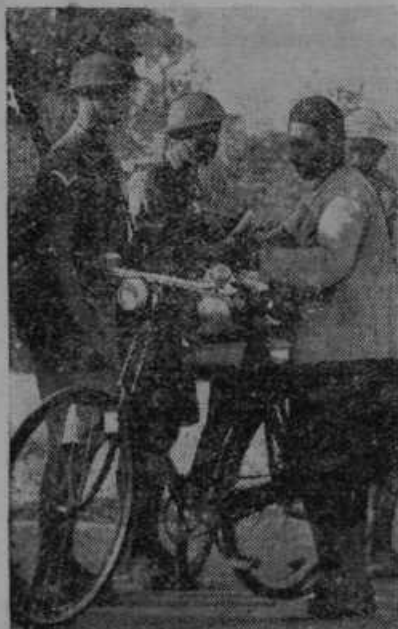
Slika iz nemirne Palestine. Angleški vojaki preiskujejo domačine.

ce JNS »Kmetkega lista« in »Domovine«. Kako pa naj bo podeželska mladina olikana, skromna in vljudna, če čita v JNS listih, da je treba politične nasprotnike obkladati s priimki »duševno bolan, nor človek«, »oblizan grešnik, ki laja kot stekel pes«. Naj kmetški fant drugemu zabrusi