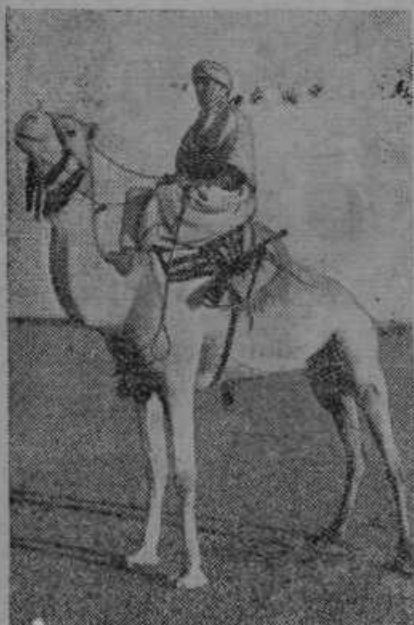
Italijanski vojvoda d'Aosta, novi abesinski podkralj, jezdi na kameli.

3. Tisti, katerim pa je naročnina že potekla, pa naj čimprej pošljejo za naprej. Zdaj, v decembru, bo »Slov. gospodar« najbolj obširen. Za Božič bo obsegal poleg običajnih 16 strani še osem strani posebne božične priloge. Za novo leto pa lep stenski koledar. Kaka škoda, ako bi se vam »Slovenski gospodar« sedaj ustavil!