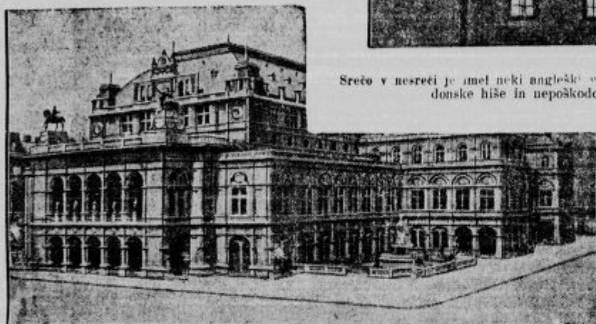
Dunajska opera, pred katero se je nedavno izvrši napad na albanskega kralja Zoguja, katero smo že poročali, se je šel kralj tja zdraviti. Številni albanski izgnanci, ki živijo na Dunaju, so sklenili kralja umoriti. Strel iz revolverja so ubili njegovo spremljevalca, sam pa je ostal nedotaknjen.