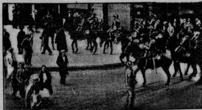
Španiji grozi kri, pa vendar — nori. Zgornja slika nam kaže pustne maskare, ki so se letos posebno sijajno odlikovale, spodnja slika pa kaže krvavi spopad med republikanci, ki hočejo zapoditi kralja Alfonza iz dežele in med kralju zvestimi četami.