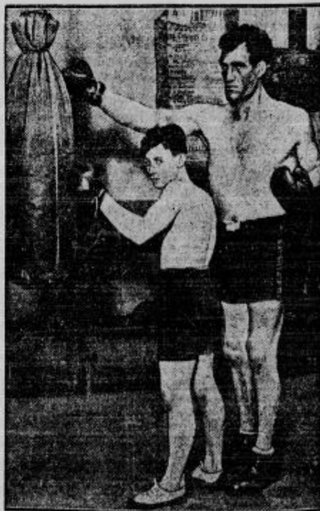
Najmočnejši človek na svetu bo odslej naprej najbrž Švicar Montana. 2 m 7 cm je visok in 254 funtov tehta. Doslej je bil kmet, sedaj se pa uči boksaške umetnosti. Na sliki vidimo, kako s svojim tovarišem, človekom navadne velikosti preizkusa svojo moč nad vrečo peska.

»Le nikar tako visoko, gospod urednik« je odvrnil poet užaljen »saj niste vi edini, ki bi tega ne natisnil.«