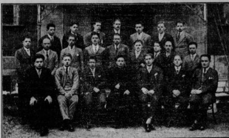
Naši fantje iz Sodražice, Komende in Rovt, ki so opravili duhovne vaje v »Domu duhovnih vaj« v Ljubljani od 31. jan. do 4. febr. 1931. — Nepopisna je sreča, ki jo užijejo mlade fantovske duše v treh dneh samote v pogovoru s svojim Bogom. Slovenski fantje! Prepričajte se sami, povprašajte tiste, ki so že bili pri takih duhovnih vajah in sledite jim!

Ko je Starič prišel domov mu je dejala žena: »Meni se zdi, da je naš sosed nevoljen kadar naš Joško bobna na boben katerega mu je Miklavž prinesel.« »Iz česa sklepaš to?« je radovedno vprašal on. »Dopolodne je dal fantu nož ter ga oprášal, če ve kako izgleda boben znotraj.«