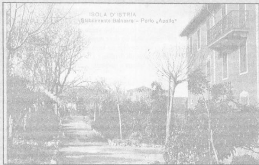
ISOLA D'ISTRIA Stabilimento Balneare - Porto „Apollo“

V Izoli imamo Park Arrigoni in vsako obmorsko mesto bi bilo ponosno, če bi imelo kaj takega. Mi pa, kod da ga ne cenimo dovolj. Sprehodite se skozenj zdaj, ko so drevesa brez listja in je park utonil v spanje. Morda boste lažje spoznali kraj, stezico ali vilo, ki jih je času iztrgala razglednica iz leta 1913. Lahko se z Mandračem v roki odpravite odkrivati 80 let stare sledi, saj sprehod nikomur še ni škodil.