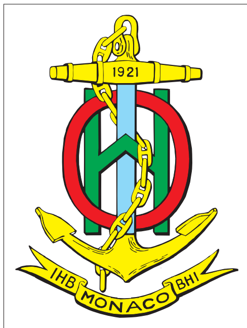
Slika 1: Logo Mednarodne hidrografske organizacije.

Za razmejitev vodnih teles (na primer oceanov, morij, jezer, rek) in njihovo poimenovanje je v svetovnem merilu pristojna Mednarodna hidrografska organizacija (francosko Organisation hydrographique internationale , angleško International Hydrographic Organization ), ki je bila ustanovljena leta 1921 in ima sedež v Monaku. Sprva je bila le znanstveno združenje, od leta 1970 pa deluje tudi kot medvladna posvetovalna strokovna organizacija na hidrografskem področju v tesni povezavi z Organizacijo združenih narodov. Leta 2003 je Generalna skupščina Organizacije združenih narodov z resolucijo tudi formalno uredila sodelovanje z Mednarodno hidrografsko organizacijo in njenimi petnajstimi regionalnimi hidrografskimi komisijami (medmrežje 1). Slovenija je njena polnopravna članica od leta 2002