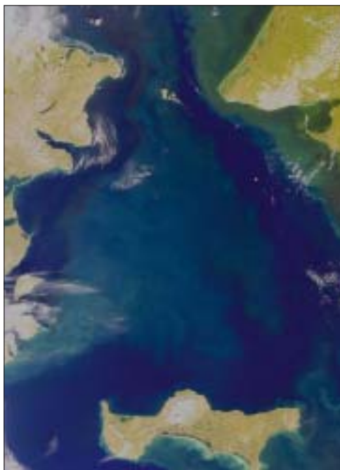
Slika 3: Agulhaški rt je skrajna južna točka afriške celine. Na zahodu ga obliva Atlantski ocean, na vzhodu pa Indijski ocean. Na sliki, ki jo je posnel satelit »SeaStar spacecraft« 28. novembra 1998, je južni del Afrike, v levem zgornjem delu se vidi tudi zaviti tok reke Oranje.