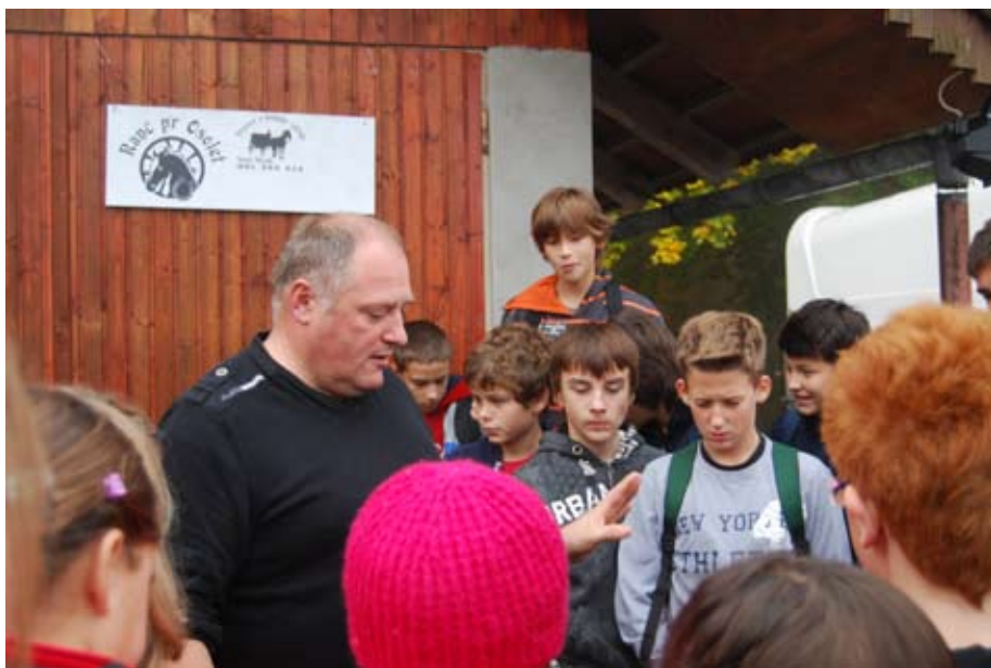
Obisk Ranča pri Osolet

Mag. Nika Cerar, vodja tabora