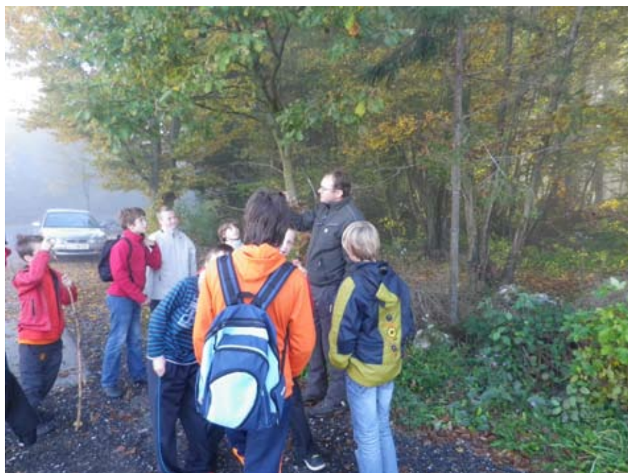
Spoznavanje dreves na terenu

Ena od delavnic, ki s e je odvijala v popoldanskem času je imela naslov »Pripovedke iz Moravske doline« po