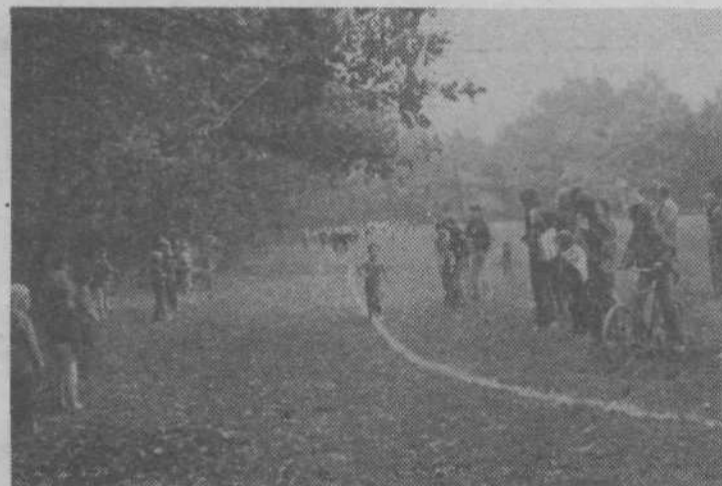
Nekdo pač mora biti najhitrejši