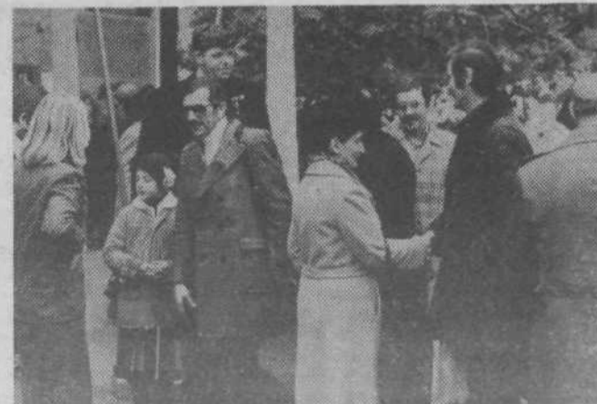
Tovariški stisk rok ob snidenju

V skladu z listino o pobratenju je ŠD Slovan konec oktobra organiziralo dvodnevno srečanje pobratenih športnikov iz Trsta. Športni, pa tudi družbenopolitični in narodnostni poudarek je organizator požalhtil z globino drobnih medčloveških odnosov, ki so dajali ton vsemu srečanju. Res se je zvrstila vrsta športnih srečanj, res so dosegli tudi nekatere lepe rezultate, a v dveh dneh se je staklo toliko tovariških stikov, poglobilo toliko poznanstev, da velja poudariti predvsem to plat srečanja. Naj z nekaj posnetki to tudi prikazemo.