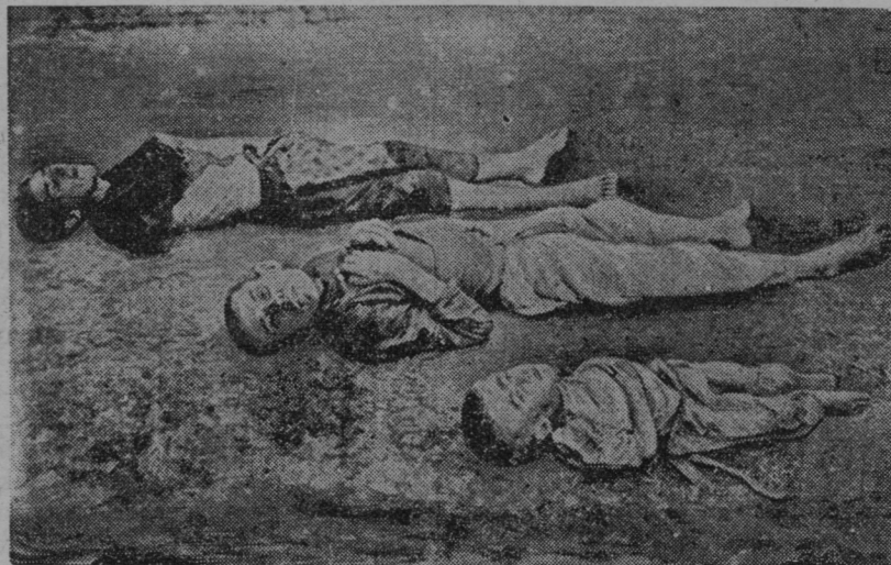
Žalostna slika iz sovjetske Rusije, kjer že umirajo ljudske mase od lakote pred pričetkom zime.