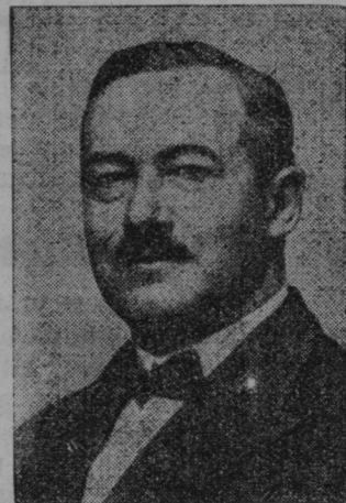
Novi madžarski ministrski predsednik Daranyi.

Razne požarne nesreče. V okolici Maribora sta bila v noči 14. oktobra kar dva požara. Na Pobrežju je uničil ogenj go-