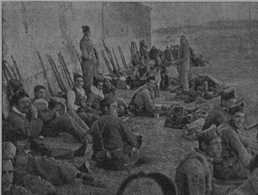
Rdeči miličniki pripravljeni na obrambo Madrida, ki je obkrožen od uporniških čet.