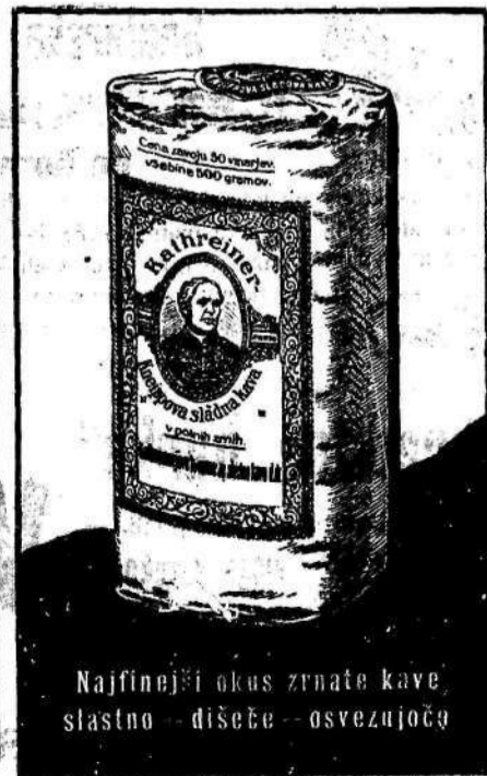
Najfinejši okus zrnate kave slastno - dišeče - osvežujoča

Odgovorni urednik in izdajatelj Ivan Kavčič v Gorici. Tiska: »Goriška Tiskarna« A. Ombriček (odgov. J. Fabčić). Zaloga: Družba za izdajanje listov »Sofa« in »Primorec«.