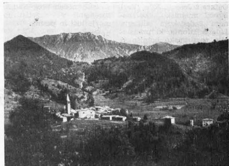
Vas Platišče v občini Tipana

prodira avtomobilizem tudi v naše hribovske vasi. A treba je ustvariti tudi druge pogoje, da bodo ljudje lahko živeli. Drugače bodo naše vasi še bolj izumirale. Zdaj imamo v vasi precej manj kakor 10 učencev, ki hodijo v šolo. Če ne bomo razumeli potreb mladih ljudi, bodo, ko bodo dorasli, zapustili domove ter odšli, kot pravimo po domače, s trebuchom za kruhom. Naša vas nima velikih možnosti, a če bi oblasti uresničile pričakovanja, ki smo jih našli, bi se naše življenje spremenilo precej na bolje. Zato upamo, da naša pričakovanja ne bodo ostala neuslišana.