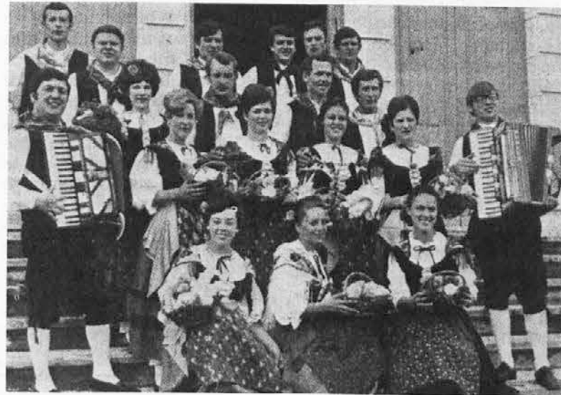
Furlanska folklorna skupina ob desetletnici «Fogolarja» v Bazlu

Bil je to nepozaben večer in velik uspeh za Furlane in naše delavce, ki delajo v okolici Berna. Pokrajinska turistična družba iz Vidma pa je ponudila sedemdnevno bivanje v Lignanu miss Fogolar, ki so jo bili izvolili na tem večeru.