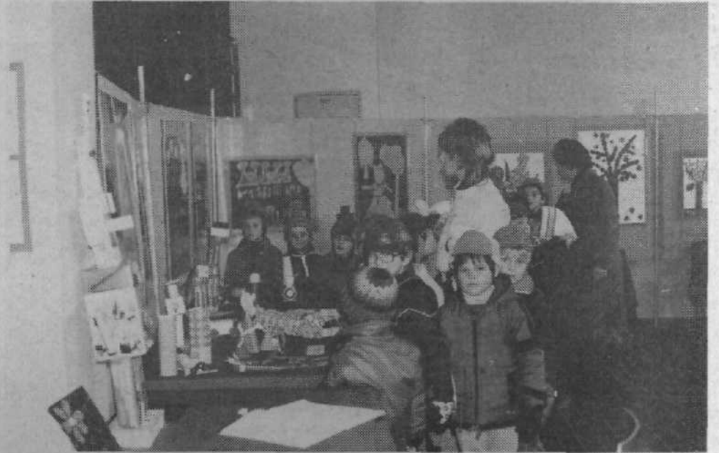
»Veliko stvari lahko čaka, vendar ne otrok. Otroku ne moremo reči – »jutri«. Njegov čas je »danes«. V letu otroka so pod tem geslom v domu družbenih organizacij Stadion pripravili izredno privlačno razstavo ročnih izdelkov in risb cicibanov iz bežigradskih vrtec. Za razstavo je veliko zanimanje, iz dneva v dan si jo prihajajo ogledovat mladi iz vrtec in bežigradskih šol, pa tudi številni občani, ki prihajajo na razne sestanke v družbeni dom.