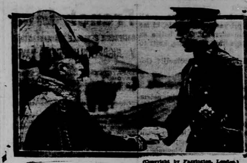
Belgijski kralj in lord French, poveljnik angleških armad.