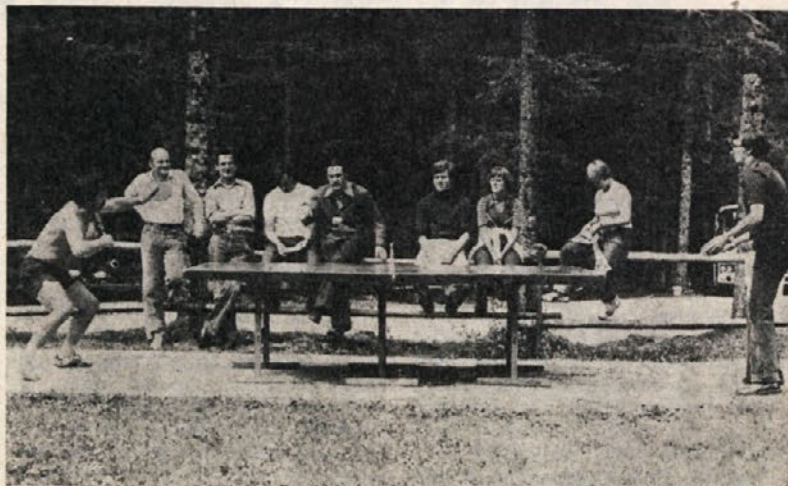
Zanimivi so bili tudi dvoboji v namiznem tenisu

Naši strelci — prijetno razpoloženi pred našim domom v Logarski dolini