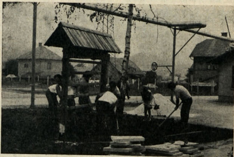
Planinci udarniško urejajo svoj propagandni kotiček. Prijetno za oko, posnemanja vredno