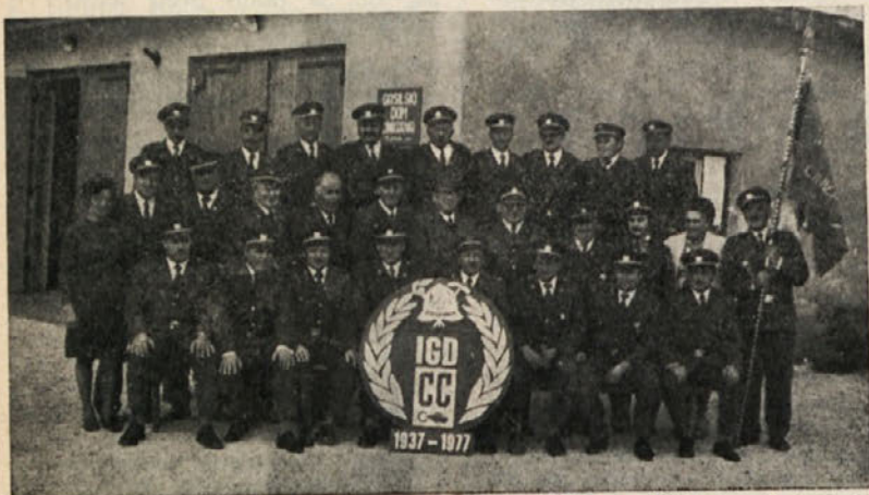
40 let IGD — 40 let požrtvovalnega dela mnogih članov kolektiva, ki so se zavestno odločali varovati naše imetje pred požarom, je pomembni jubilej