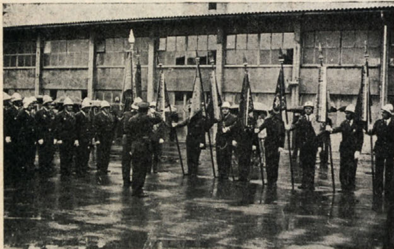
Ešelsoni gasilskih enot, postrojeni pred slavnostno tribuno