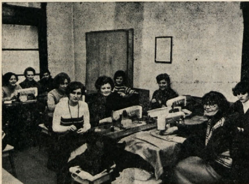
Udeleženke šiviljskega tečaja, ki ga je priredilo zastopstvo znane tovarne šivalnih strojev Bagat

katere obupavale, saj smo bile precej na tesnem in pouk se je začel s spoznavanjem šivalnega stroja, čiščenjem le-tega in sploh s stvarmi, ki nas niso preveč pritegnile. Kmalu pa je prišlo na vrsto krojenje, nato šivanje in ko smo si merile prve kose oblačil nas je delo pritegnilo. Kljub temu pa je za nadaljevalni tečaj ostalo samo 15 udele-