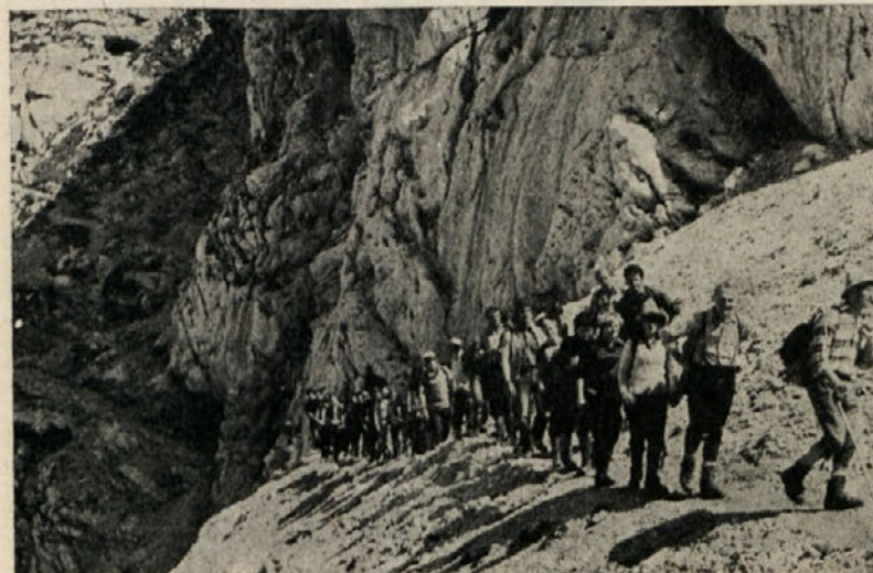
Naši planinci pred kočo na Doliču po uspešnem vzponu na Triglav