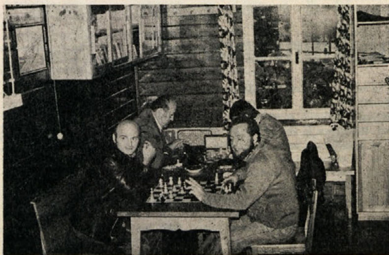
Interno prvenstvo v šahu v konkurenci posameznikov so šahisti odigrali v našem domu v Logarski dolini