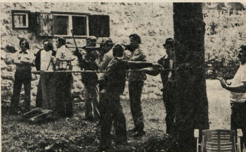
Vsi so merili v črno, letelo pa je tudi v belo