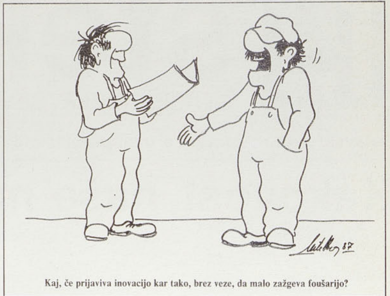
Kaj, če prijavi inovacijo kar tako, brez veze, da malo zaževa fousarijo?