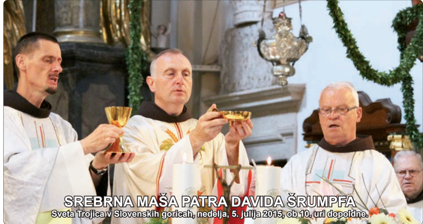
SREBRNA MAŠA PATRA DAVIDA ŠRUMPFA Sveta Trojica v Slovenskih goricah, nedelja, 5. julija 2015, ob 10. uri dopoldne.