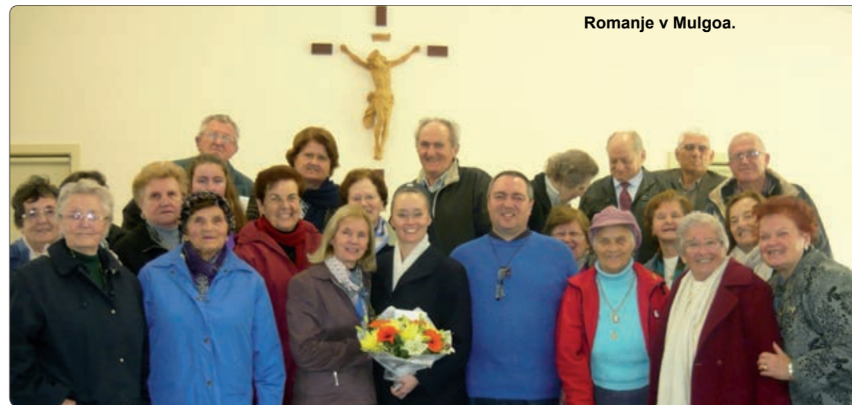
Romanje v Mulgoa.