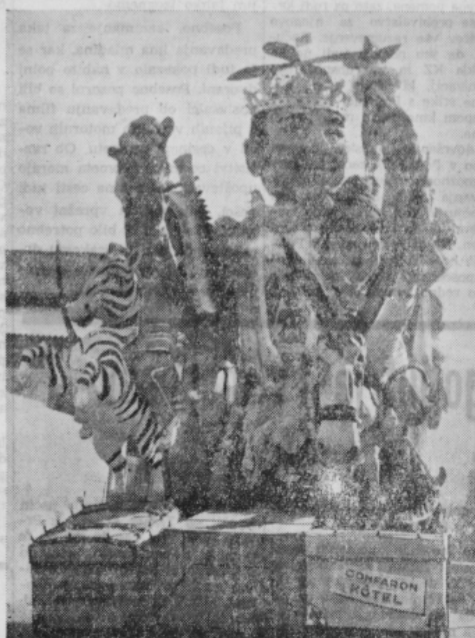
Posnetek s karnevala

mnoho zanimivega, kar pa je šlo že v pozabo. Ko sem bil še mlad, sem bil organizator maškerad v našem kraju. Spominjam se, kako so pri nas v Osluševcih vlačili koptanje, spominjam se svoje-