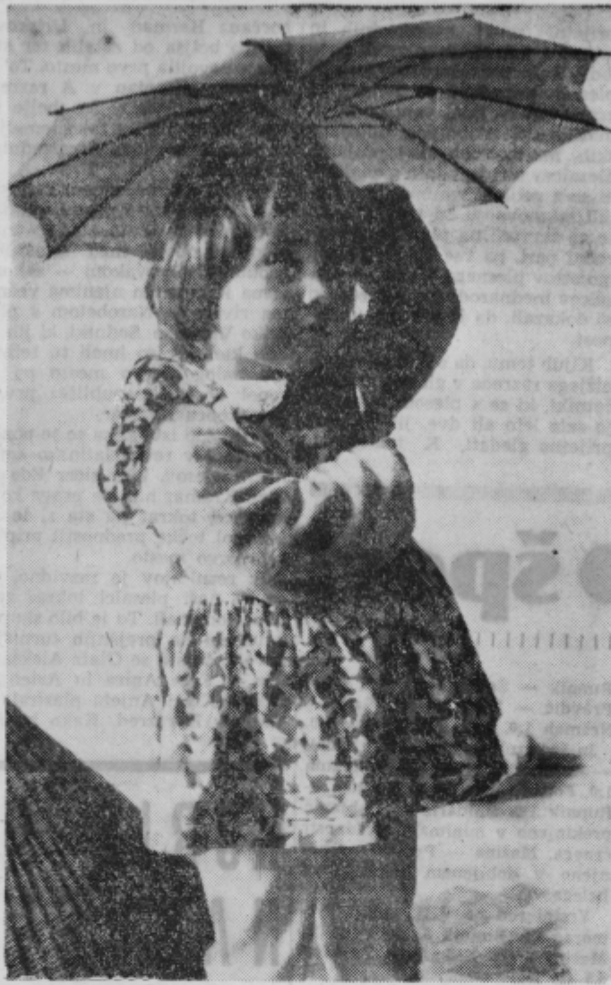
IZ REVJE OTROK IN DRUŽINA