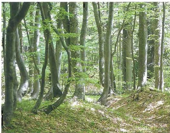
Gozd v Mali Pišnici

Današnji politični, upravljavski ali znanstvenoraziskovalni pristopi k izbiri in ustanovitvi neke pokrajine za zavarovano območje narave so seveda različni,