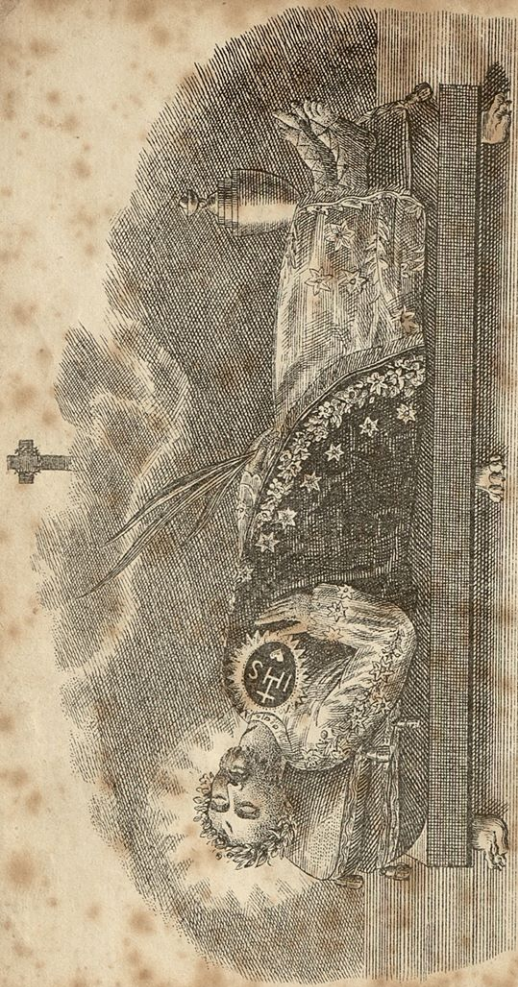
S Faustina profi sanaf