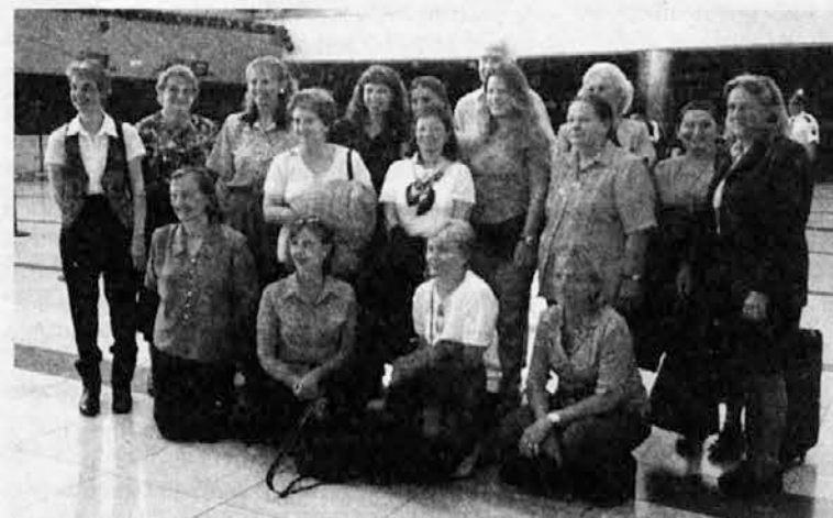
Skupina učiteljic in en profesor iz Argentine

Prišel je dan! Danes, 18. januarja, so bile hospitacije . S kakšnim veseljem sem to pričakala.