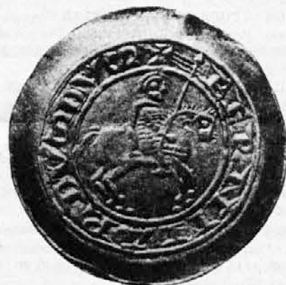
Denar Spanheima Bernarda iz ljubljanske kovnice (po 1215)

Svobodna Slovenija, št. 11; 18. marca 1951