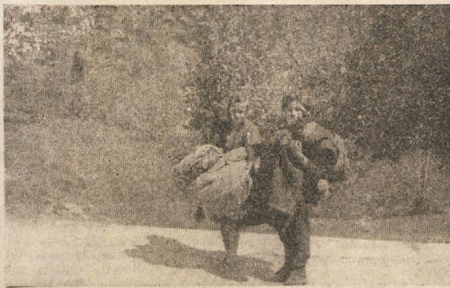
Vse je bežalo pred fašističnimi zvermi; domovi so goreli, padali so strela in otroka sta se podala v partizane. Tako usodo je koval fašizem delovnim ljudskim množicam.

Polagoma in tiho so se skupine oddelile ena od druge. Še gosto gromovje in pred njimi je ravna plo-