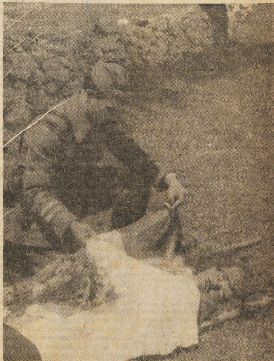
Junaško so znali umirati borci za svobodo delovnega ljudstva. Njihova kri je pordila slednjo ped svete primorske zemlje in tako na slednjem koraku zaznamovala zahtevo primorskega ljudstva: Tukaj je Jugoslavija! V takem poletu je padel 50. junija 1944 pri Lokvah načelnik XXXI. divizije, žrtvujoč se za uredničenje vseh težej tisočeri, po fašizmu izkoriščanih in zatiranih primorskih ljudi.