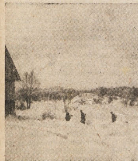
Narodno osvobodilna vojska na pohodu v vas.

Primorsko ljudstvo, ki je dalo iz svoje srede nepregledno vrsto borcev za narodno svobodo je enotno vedno te borce navdihovalo s svojo brezprimerno narodno zavestjo, predanostjo, požrtvovalnostjo in borbenostjo. Miren, Komen, Rihenberk, Cerkljske in Cerkljanske vasi — vsa slovenska zemlja od skrajnega severozapada pa do morja in do Hrvaške Istre je s svojimi požganimi domovi, oskrunjenimi svetišči, s svojimi pobitimi, onečaščenimi in v sužnost odpeljani-