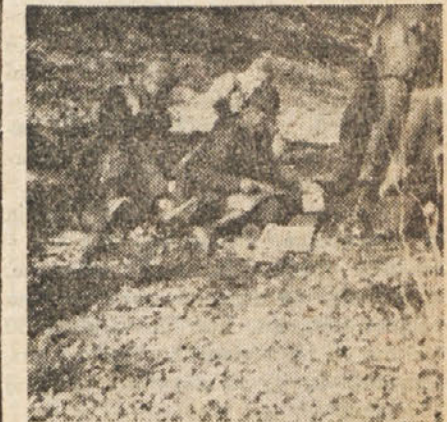
Pred vsakim pokretom je treba preučiti teren.

»Devet letal; med njimi trije lovci »Messerschmidt 109«, dva lovca »Focke Wulf«, pa še kup mrtvih Švabov!«