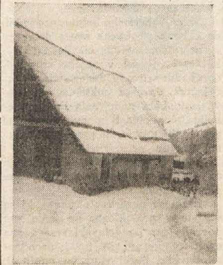
Partizanska patrola v snegu in mrazu preganja fašiste.

Brezbrizno so še dalje mežikale številne luči v bližnjem mestu Vidmu.