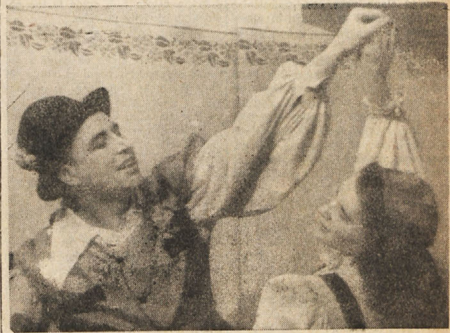
Igralska skupina IX. korpusa je s svojimi umetniško dognanimi nastopi gojila kulturo med borečimi se junaki in po osvobojenih predelih Primorske.