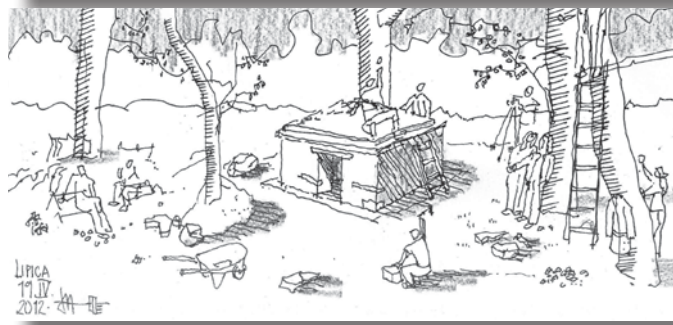
Slika 3: Niz skic od zakoličbe do postavitve.