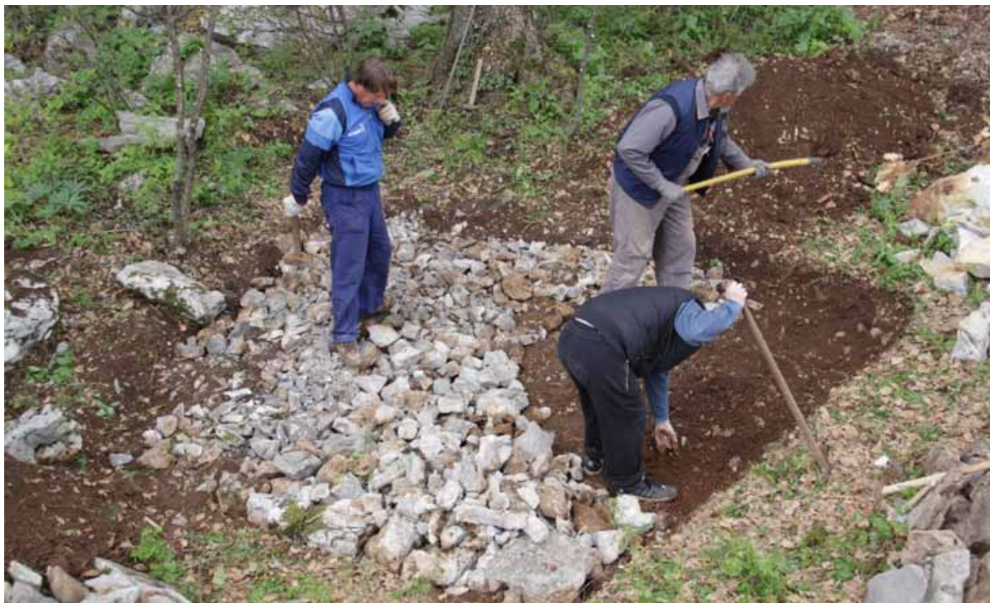
Slika 1: Priprava temelja hiške.