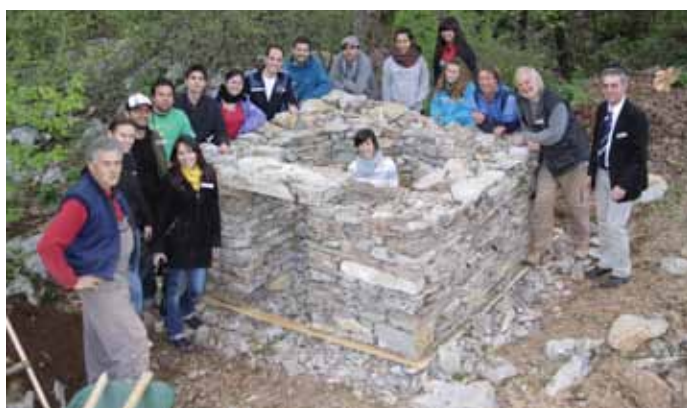
Slika 4: Potek dela od zasnove do postavitve.