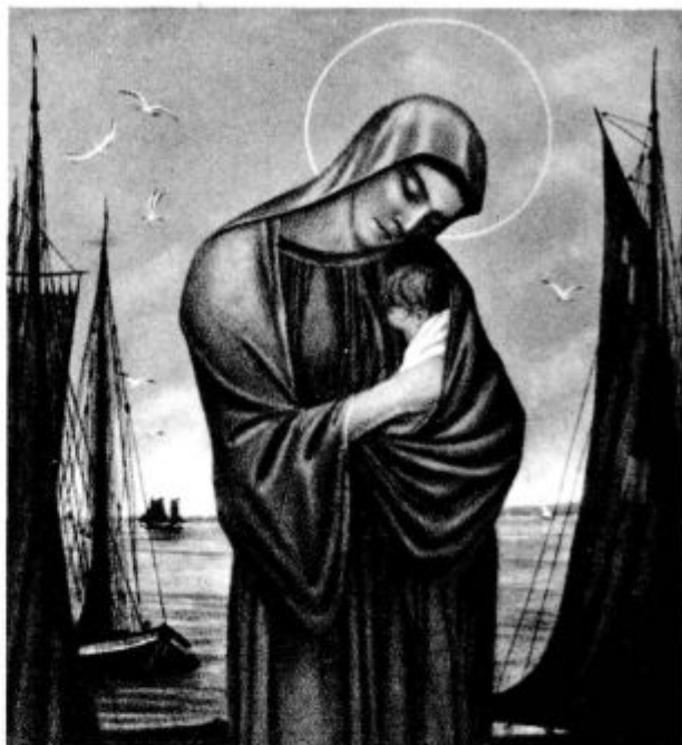
„Čez morje in čez polje“ (K pesmi: Marija v božji naravi IV.)

»Prosim vas, naj ne bo moje priporočilo zastoj,« opominja končno Friderik Baraga. Bolj kot našim prednikom veljajo njegove besede nam. Dalje pravi goreči misijonar: »Prosim vas tudi, da izmolite včasih kak sv. rožni venec za spreobrnjenje nevernikov v Ameriki«. Z molitvami za prospah misijonov bomo pa mi združevali tudi molitev za poveličanje Baragovo. Kakor tedaj, ko so brali naši predniki knjigo o rožnem vencu in so spletali potem večer za večerom rožne vence v čast Materi božji in je ni bilo v vaseh niti ene hiše, iz katere se ne bi bila dvignila pobožna molitev sv. rožnega venca vsak večer k Bogu, tako naj bo vsem molitvam slovenskih družin dodana še dan na dan molitev za poveličanje našega misijonarja in škofa Barage. Molili bomo te molitve v gorečem zaupanju, da bo Bog uslišal naše priprošnje in podelil škofu Baragi čast oltarja, obenem pa bomo po svojih močeh prispevali za Baragovo semenišče v Ljubljani.