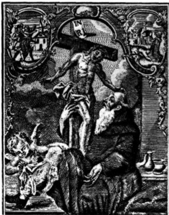
Sv. Peregrin (26. aprila)

Bakrorez iz srede 18. stol. kaže svetnika z ranjeno nogo, ki mu jo Križani ozdravi. Slika je na Brdu posebno v časti. Tu je bila nekaj sloveča božja pol, kjer so se godili tudi čudeži na priprošnja sv. Peregrina