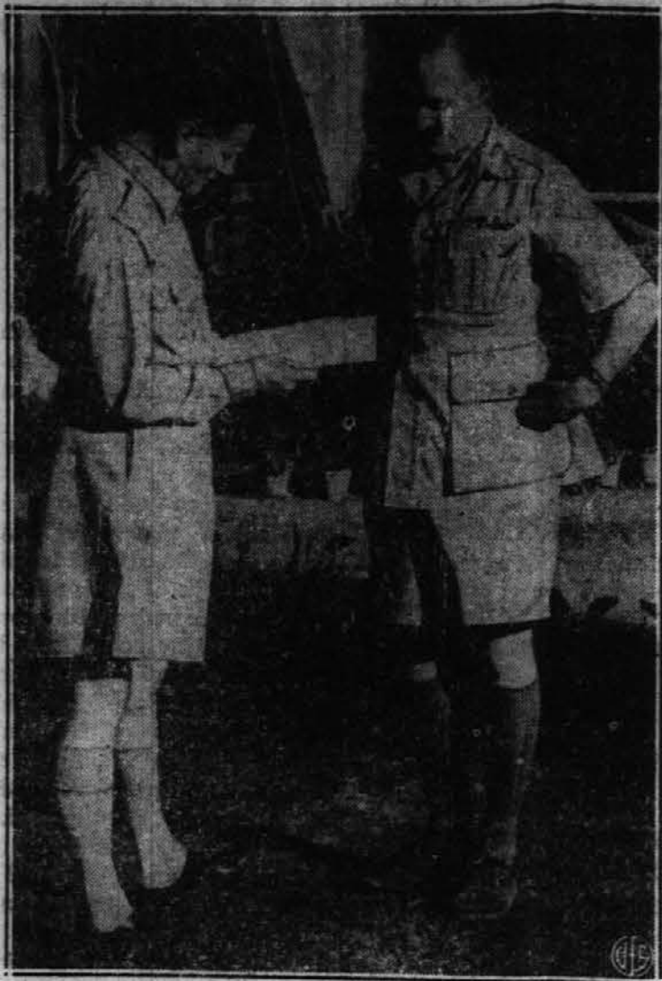
Na desni je generalni major N. M. Ritchie, vrhovni poveljnik britanske armade v Libiji, ki je star 44 let. Slika ga kaže v razgovoru z generalom Auchinleckom.

ščitno države v Trstu, je bilo so se zavedali posledic. Pri danes obsojenih na smrt zaradi zarote proti vladi in zaradi terorističnih del, deloma še pred začetkom sedanje vojne. Od ostalih petdeset Slovencev so bili štirje oproščeni. Tri in dvajset je bilo obsojenih na trideset let težke ječe. Eden na štiri in dvajset let. Trije na šestnajst let, šest na dvanajst let. Ostalih sedem na krajše kazni. Obsojci nimajo pravice do pritožbe.