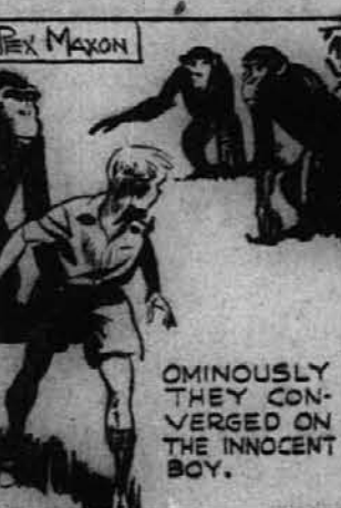
OMINOUSLY THEY CONVERGED ON THE INNOCENT BOY.

Nekdaj dne je lačen lev napadel opice. Veliki samiec se je pognal, da napade strašnega leva. Tedaj je druga opica pripomnila, da je Tarzan ubil leva s sulico in prav tako lahko napravi ta novi deček. "Ubij!" je zaklicala Tommyju Deček je razumel. Pograbil je sulico in jo zagnal proti levu. Zgrešil je lev je pa pobegnil z opico Bala. Opice so bile presenečene. Vsekako so dečka obtoževale zaradi tega. Groznilo so se tedaj obrniti proti nedolžnemu Tommyju.