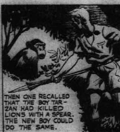
THEN ONE RECALLED THAT THE BOY TARRAN HAD KILLED LIONS WITH A SPEAR. THE NEW BOY COULD DO THE SAME.