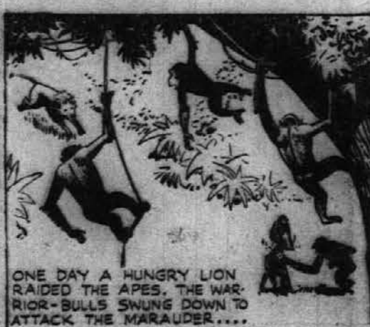
ONE DAY A HUNGRY LION RAIDED THE APES. THE WARRIOR-BULLS SWUNG DOWN TO ATTACK THE MARAUDER...