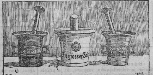
Die Mörserrumföuschaktion des Kriegsfürsorgeamtes.

Vojno-oskrbovalni urad izdal je oficijelne možnarje iz železa in porcelana (Steingut), ki se jih zamenja za mesingaste možnarje. Ti možnarji imajo prav lepo obliko, razne napise in tvorijo lep spomin na veliko vojno. — Prinašamo sliko teh možnarjev.