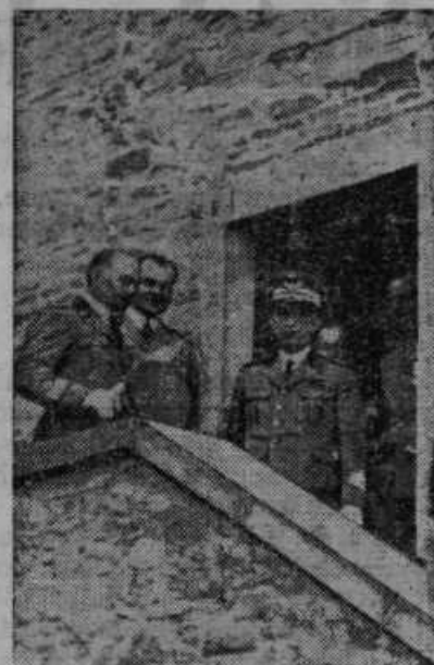
Italijanski kralj Viktor Emanuel je obiskal rojstno hišo Mussolinija v Predapio.