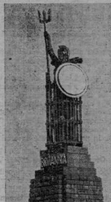
V francoskem pristanišču Boulobnes so postavili spomenik kot spomin na prve angleške vojaške, ki so tukaj stopili v svetovni vojni na suho, da pripomorejo Francozom do zmage.