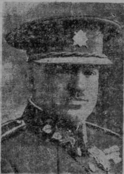
General Krejčí, generalstabni načelnik čehoslovaške vojske, ki je uvedla 3 letno vojaško dolžnost

Prostovoljci gredo iz Španije. Vse države so sklenile, da morajo prostovoljci iz Španije. Ker