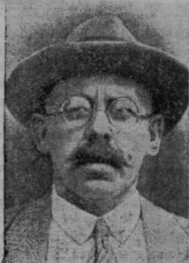
Ruski profesor Samoilovič je rešil pred desetimi leti ponesrečeno Nobilevo severnotečajno odpremo z ledolomilcem »Krasin«.

Raziskovalci. ...ij južnega tečaja Norvežan Roald Amundsen je smrtno ponesrečil 18. junija 1928, ko je odletel proti severnemu tečaju, da bi pomagal ponesrečeni italijanski odpremi pod poveljstvom generala Nobile.