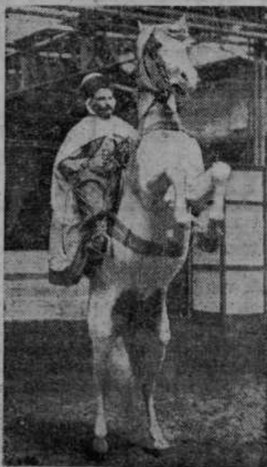
Nastop jezdeca, domačina iz Alžira v severni Afriki, na londonski olimpijadi.