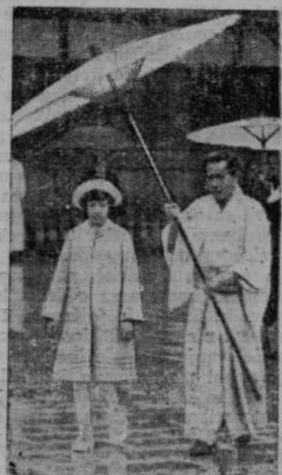
Princezinja Teru, najstarejša hčerka japonskega cesarskega para, po obisku svetišča v Tokio, ki je posvečeno spominu padlih vojakov.