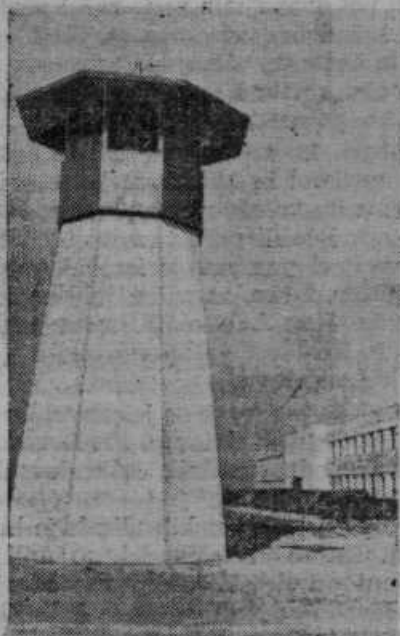
Združene ameriške države so pozidale pri Los Angeles za 1.2 milij. dolarjev veliko novo kaznilnico, ki je obdana od 4 stražnih stolpov, od katerih vidimo enega na sliki.

Ptujska gora. Slovenska javnost z zanimanjem spremlja ohranitev zgodovinskega spomenika in največjega romarskega svetišča na Štajerskem, cerkve Matere božje na Ptujski gori. Čez leto dni so trajale priprave. Popravila so velika, treba je bilo mnogo priprav. Ker so nujna, se je z delom