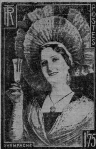
Za 300 letnico rojstva Dona Perpignan, ki je začel prvi izdelovati francoski šampanjec, je izdalo francosko pošto ravmateljstvo posebne znamke z dekletom v narodni noši iz šampanjske pokrajine.