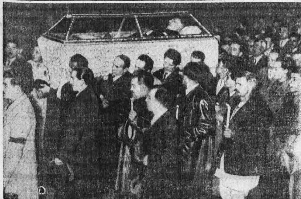
Pogreb bivšega romunskega min. predsednika Oktavijana Goge. Pokopan je bil na državne stroške in v stekleni rakvi. Casopisje poroča, da sta preminulemu »malemu diktatorju« poslala za na zadnjo pot posebno lepe vence Hitler in Mussolini.

. . . da imajo ljudje med 60. in 70. letom starosti do 30% lecitina manj nego ljudje med 20. in 30. letom starosti. S pojemanjem lecitina v telesu prihaja propadanje in tudi zmanjšanje duševne prožnosti.