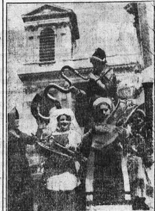
V Parizu se je nedavno otvorila razstava starih instrumentov. Med njimi se je opazilo tudi nekaj zelo redkih oblik iz 18. stoletja, ki se pa dandanes ne uporabljajo več.

Brat češkoslovaškega prezidenta dr. Beneša — znan šolnik v praškem ministrstvu — je nedavno pripovedoval, kake cvetke še vedno poganja državni birokratizem. Z zadevo nekega pljuvalnika, ki ga je zahtevalo vodstvo neke gimnazije, se je bavilo nič manj kakor 47 instanc. Ko je dobava končno bila izvršena, se je ugotovilo, da je bil pljuvalnik razbit, nakar je šla cela zadeva zopet nazaj — skozi 47 instanc.