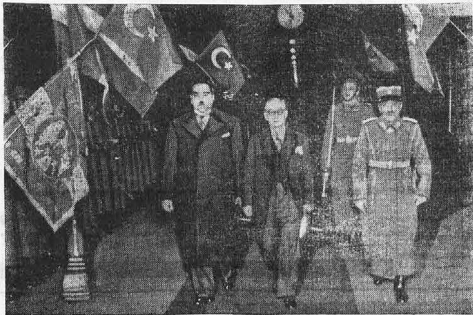
Pretekli teden je turški ministerski predsednik Dželal Bajar obiskal Beograd. Naša podoba: v družbi našega min. predsednika dr. M. Stojadinovića pri obhodu častne čete na peronu beogradskega kolodvora. — Ta obisk je ponovno utrdil jugoslovansko-turško prijateljstvo in ojačil splošna mirovna prizadevanja na Balkanu.

Nekaj časa je že, odkar se v znanstvenih krogih pripravajo o tem, da-li so rastline okamenele pred milijoni let. Rešitev tega vprašanja je namreč velike važnosti za časovno določitev posameznih epoh ali razdobjih zemlje. V Alaski so našli sedaj okamenjene rastline, ki so dokazano okamenele šele pred 25 leti. Te okamenitve so nastale vsled upliva vulkanskega pepela. Te »nove« okamenitve so onim starim, nekaj milijonov let nazaj segajočim okamenitvam v Oregonu za 100 podobne. Ali je to res že začetek reforme geološke svetovne slike?