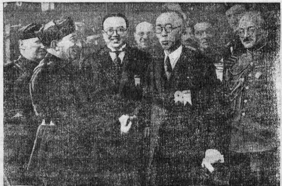
Poset italijanske fašistične delegacije v Mandžuku, pokrajini, ki so jo Japonci iztrgali Kitajcem in proglasili za samostojno državo.