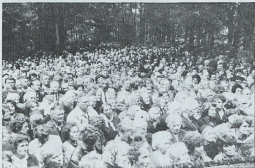
Udeleženci v Kočevskem Rogu, 25. 6. 95.