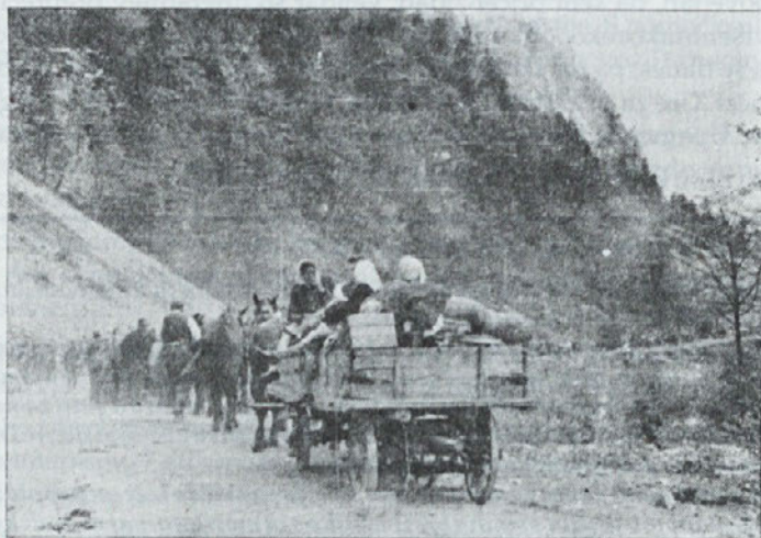
V varstvo k zaveznikom.