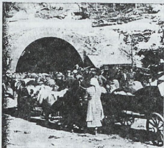
Ljubeljski predor maja 1945