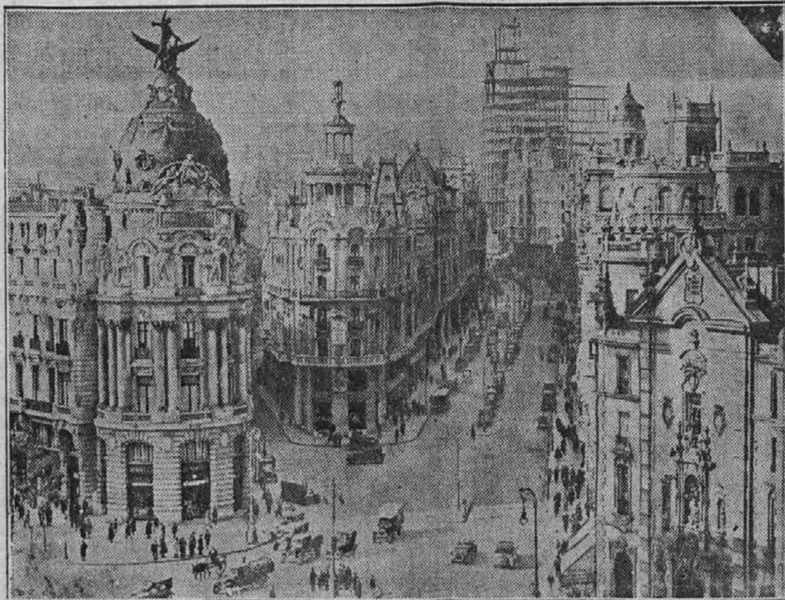
Glavna ulica mesta Madrida, takozvana Puerta del Sol. Okusno zgrajene stavbe, ki se vidijo na sliki, utegnejo te dni postati žrtev artilerijskega in zračnega bombardiranja, ko se sedanja civilna vojna v Španiji, ena najbolj besnih, kar jih je svet videl, približuje svojemu najbolj divjemu višku — boju za prestolico.