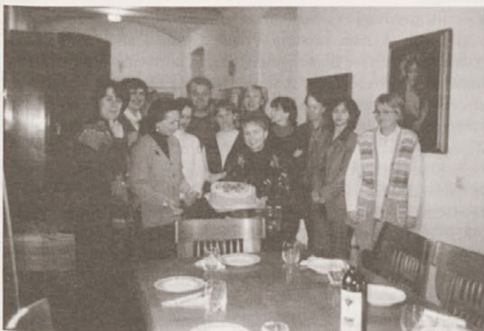
Udeleženci in udeleženke 2. muzejske delavnice v Loškem muzeju 29. 11. 1999