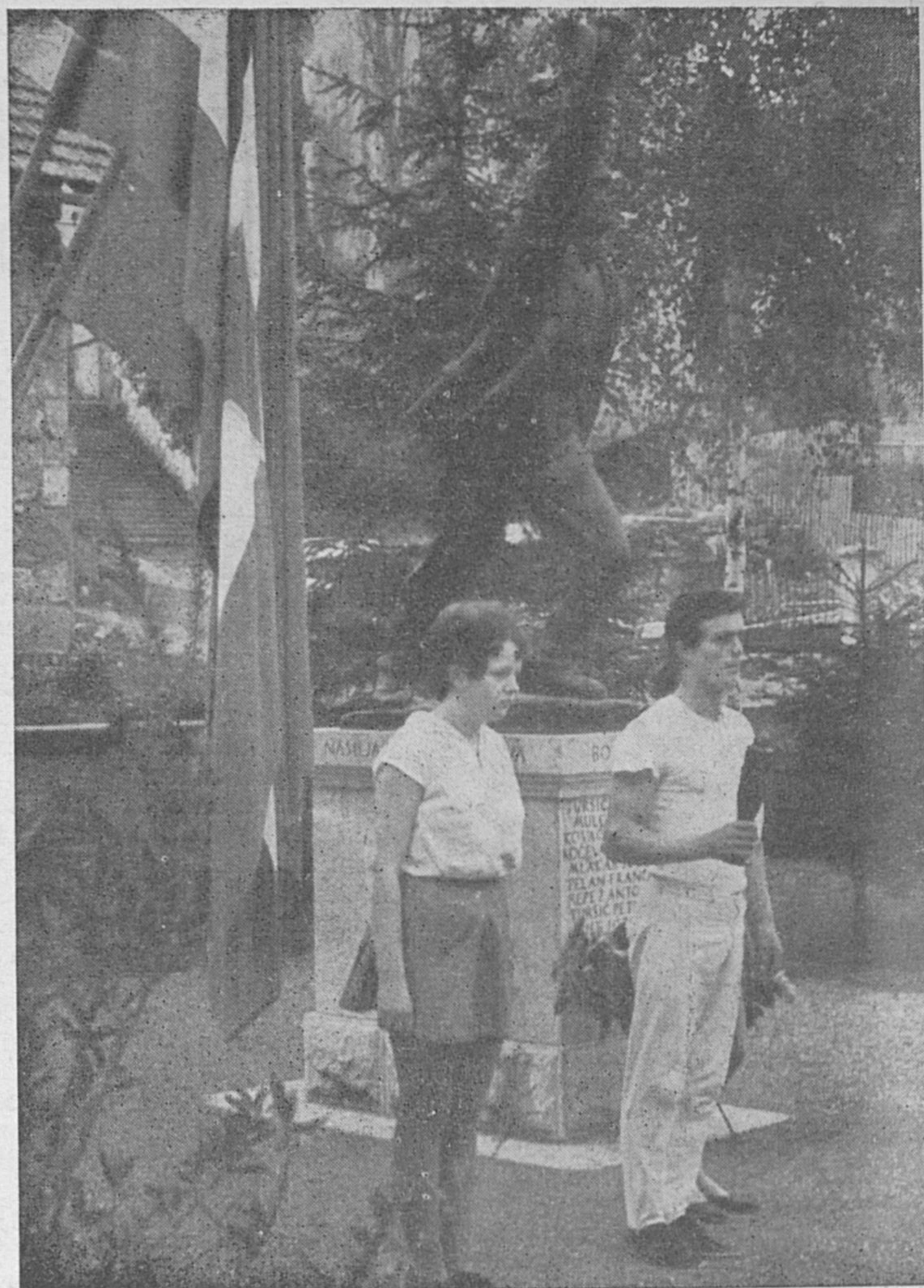
Stareta mladosti v Cerknici

Želiš odgovor od katerekoli službe v občini? Pgotrebuješ pravni nasvet? Piši uredništvu Glasa Notranjske in že v naslednji številki boš dobil odgovor.