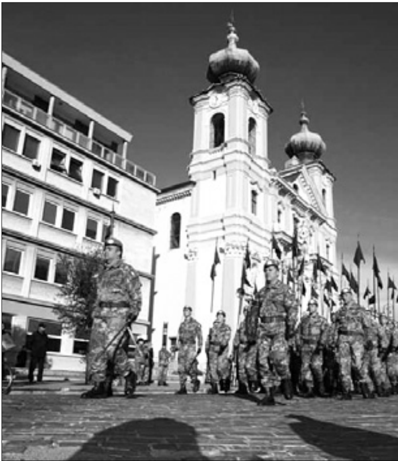
Brigada Pozzuolo se je v Gorico vrnila iz svoje zadnje misije