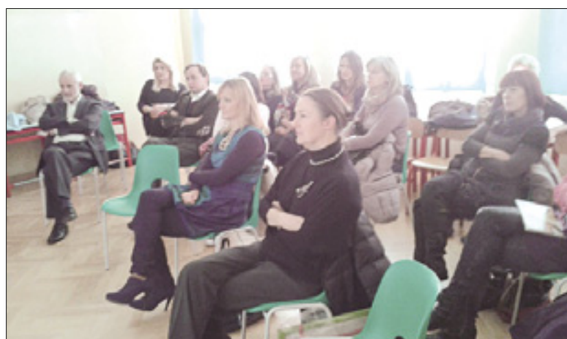
Učiteljice obeh šol si od projekta veliko obetajo