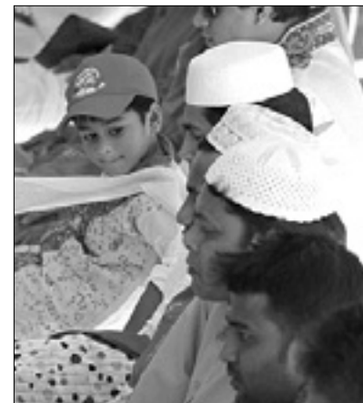
V trziški medresi

Med preverjanjem stanja se je izkazalo, da muslimanska skupnost ni razpolagala z ustreznimi dovoljenji za uporabo stavbe, v notranjih prostorih pa je tudi opravila nekaj del, ki niso v skladu z varnostnimi predpisi. Občina je iz istih razlogov prepovedala tudi uporabo stavbe v Ulici Duca D'Aosta, kjer je bil nekoč se-