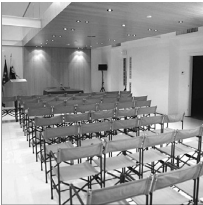
Osvetljena in opremljena dvorana Trgovskega doma