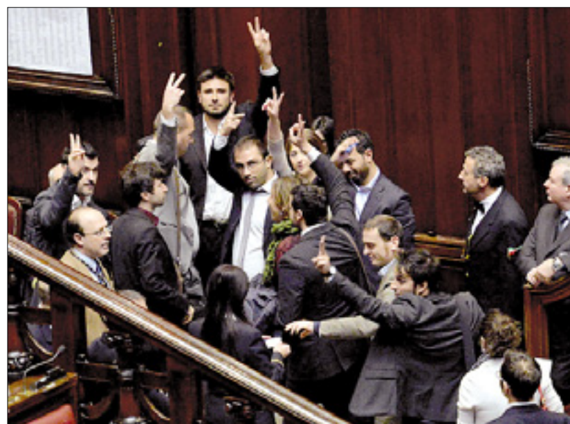
Protest poslancev Gibanja 5 zvezd

vsakem trenutku lahko izglasuje nov volilni zakon. Obenem je predsednik poudaril, da je imperativ premostitev proporcionalnega sistema, poleg tega pa zmanjšanje števila parlamentarcev in preseganje dvojnika senat-poslanska zbornica. Problem je, ali je glede tega volja v parlamentu, ali je ni, je še dejal predsednik.