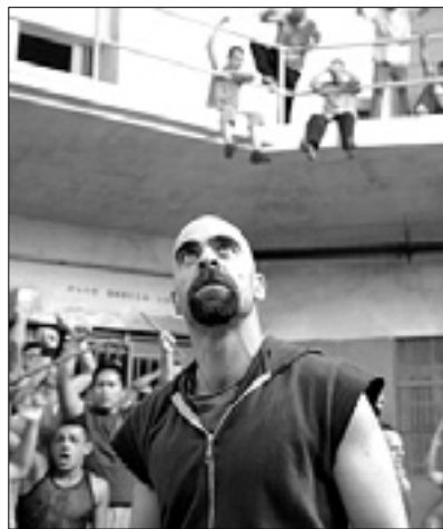
23.35 Film: Cella 211

6.55 Risanke 8.35 Nan.: Settimo cielo 10.00 Dnevnik: Tg2 Insieme, sledijo rubrike 11.00 I fatti vostri 13.00 Dnevnik in rubrike 14.00 Detto fatto 16.15 Nan.: Ghost Whisperer 17.00 Nogomet: žreb za svetovno prvenstvo 2013, prenos 17.45 20.30, 23.20 Dnevnik in športne vesti 18.45 Nad.: NCIS 21.00 LOL – Tutto da ridere 21.10 Talk show: Virus – Il contagio delle idee