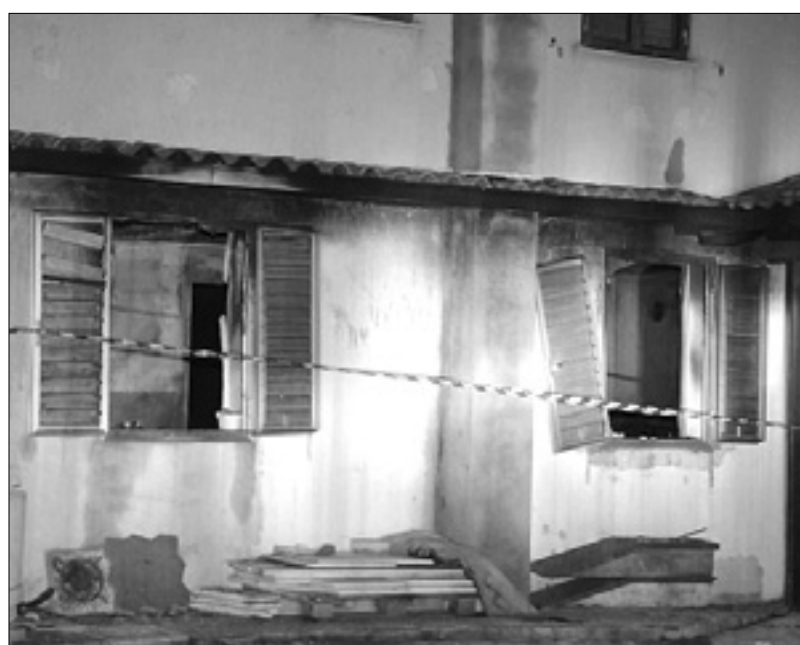
Na hiši znamenja požara