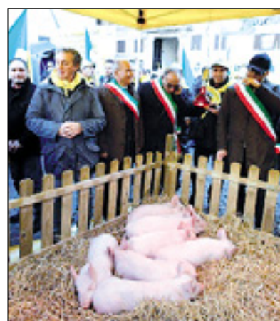
Prašički pred parlamentom

Po podatkih Coldiretti italijanska prehrambena industrija okoli 33 odstotkov hrane, ki jo prodajo v Italiji ali iz-