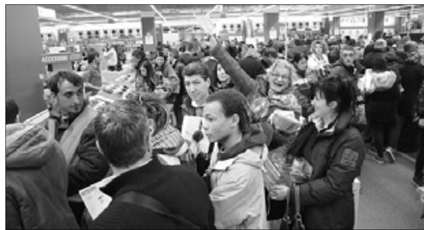
Slovenski napisi in gneča v trgovini Mediaworld