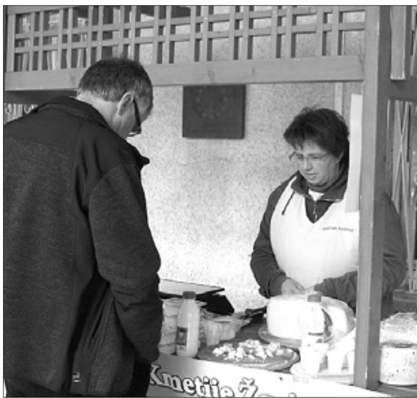
Tržnica bo pred občinsko stavbo v decembru vsako sredo in petek