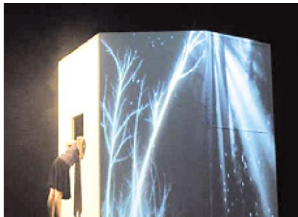
Na odru je s plesalci je samo kockasta struktura