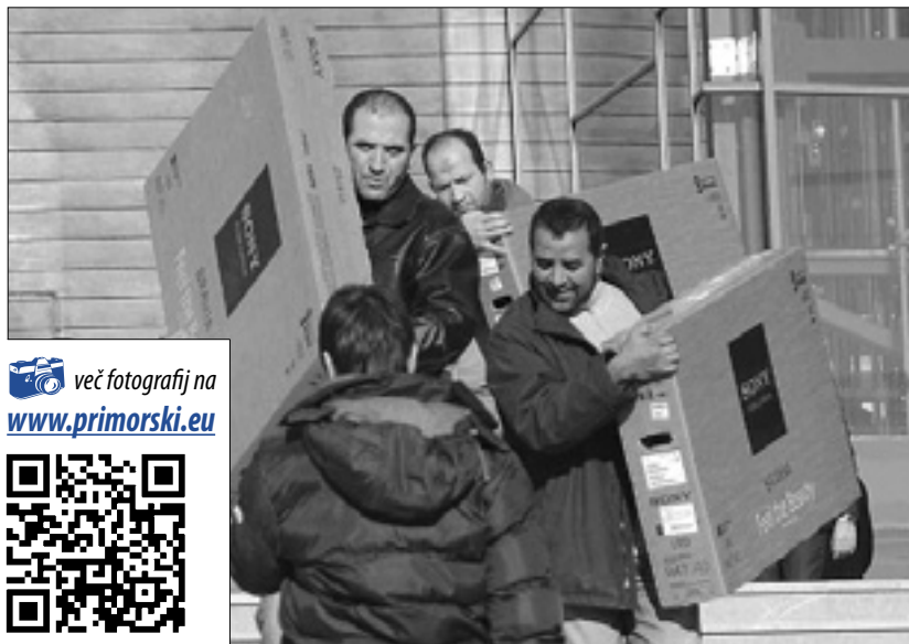
Domov se vračajo s televizijami (zgoraj), notranjost središča (spodaj)

Na včerajšnjem odprtju ni bilo županov iz Gorice in drugih občin iz goriške pokrajine, ki so se odločili za bojkot, da bi izrazili bližino krajevnim trgovcem. V kolikšni meri jih bo novi trgovski velikan oškodoval, bo jasno v prihodnjih mesecih. Nedvomno je Tiare Shopping hud tekmeč za večja in manjša nakupovalna središča v Trzinu, Ronkah, Vidmu, seveda tudi v Novi Gorici. Se bodo velike ribe pojedle med sabo? (dr)