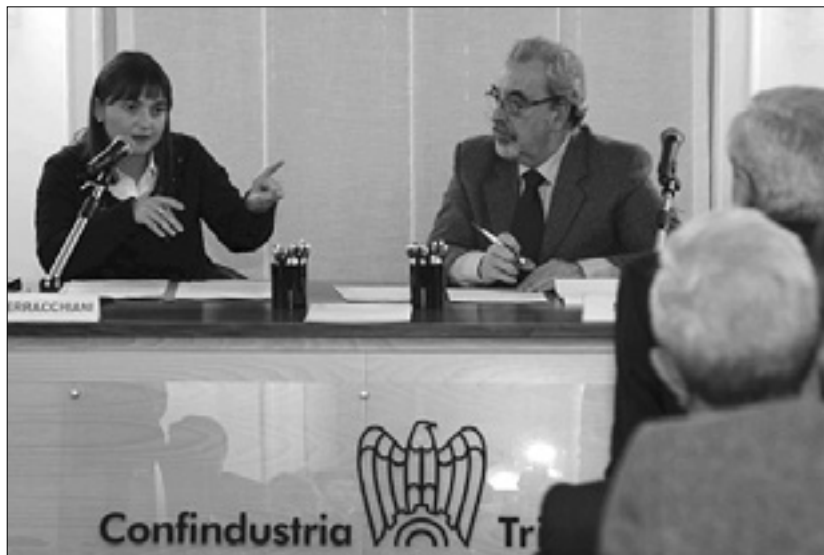
Predsednica Dežele FJK Serracchianijeve s predsednikom Confindustrie Razetom

Splošno vodilo je, da bo nadaljevanje industrijske dejavnosti, za kar se