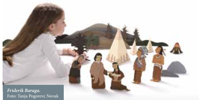
Friderik Baraga.

Otipljiv lik oz. lutka otroci doživljajo kot samostojno živo bitje, ki jih nagovarja in z njimi ustvarja odnos. Z njo komunicirajo, usklajujejo mnenje, doživljajo čustva in se intenzivno vključujejo v dogajanje.