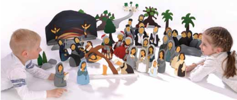
Križev pot.

Ob dramski aktivnosti otrok razvija inteligentnost, ustvarjalnost in socialne veščine, kot so opazovanje, poslušanje, potrpežljivost, spoštovanje, sprejemanje drugih idej in medsebojno sodelovanje.