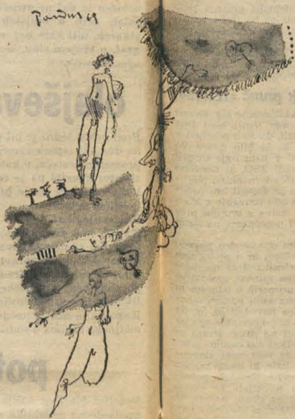
VINJETI: LAJČI PANDUR

Za 23. MFSK naj bi bila značilna družbena kritičnost, angažiranost, morda še več, vendarjenje tako imenovanega političnega gledališča. Takoj po njegovi napovedali, to so upoštevali pri izboru del in delov, karali kot osnovno temo diskusije. V službeno konkurenco za skulpturo Jadro, je selektor izbral pet predstav. Med temi so bile tudi predstave, uvrščene z edinim namenu, da na odprti sceni dokažejo, kako se več ne sme dajti. Festival je bil zamišljen kot odmev na lansko študentsko gibanje in kot nadaljnja revolucionarna spodbuda, s čim da se ustvari trajna povezanost med gibanjem in sceno. Bodisi dogodki niso imeli zadosti vpliva, bodisi gledalci niso pripravljena slediti dogodkom, festival v tem pogledu ni uspel. V konkurenci je imela samo ena predstava neposredno zvezo z gibanjem, dve pa bolj ali manj posredno. Diskusije po predstavah niso dale ustreznega odziva na vprašanje, kakšna naj bo nadaljnja usmerjenost študentskih gledališč, kakšna je njihova perspektiva, vsem pa, kako naj zavza-