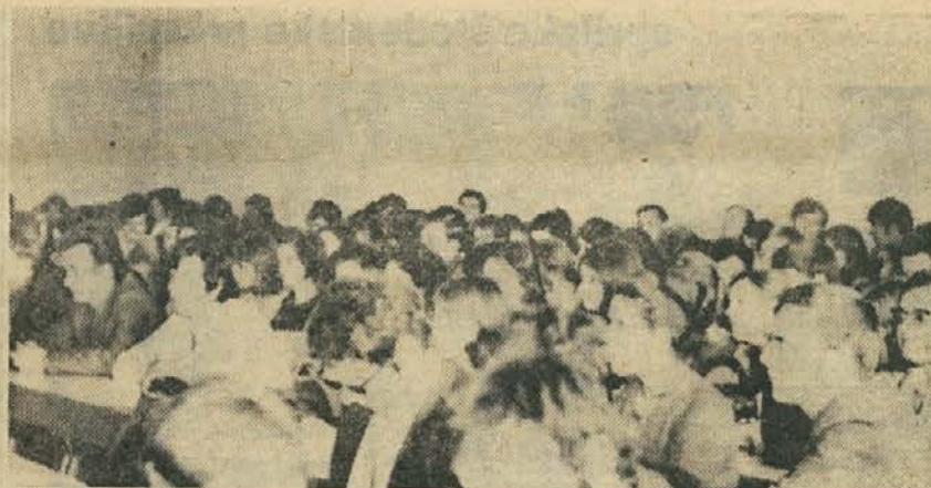
Zbor študentov VEKS