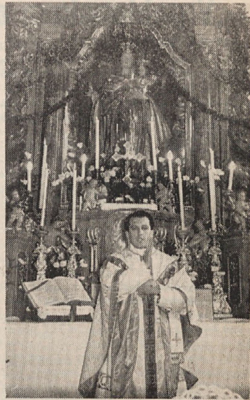
Globaški novomašnik blagoslovlja ob novi maši v farni cerkvi prvič svoje sofarane

Po opravljeni cerkveni slovesnosti so se podali svatje z novomašnikom v novo Farno dvorano k izvenckerkvenemu praznovanju