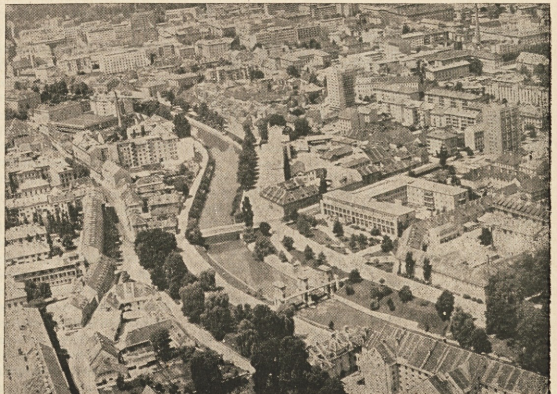
V zadnjih desetletjih se je Ljubljana razvila v veliko mesto

Na obisku pri gospodu avstrijskemu generalnemu konzulu v Ljubljani je gostitelj med gostoljubno postrežbo najprej prečital v slovensčini sledeče pozdravne besede, ki jih objavljamo dobesedno: (Dalje prihodnjič)