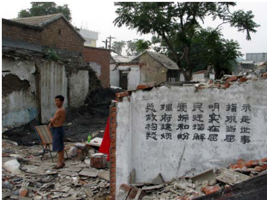
Figure 7: Meishi streets, a symbol of the fight against Chinese policy large urban plans. The demolition of the neighborhood and the traditional patterns of communal life in the hutongs for the upcoming Olympic games (from the film Meishi Street, Ou Ning).

Slika 8: Ulica Nanjing – sodobni kitajski javni prostor v domeni potrošnje in zabave.