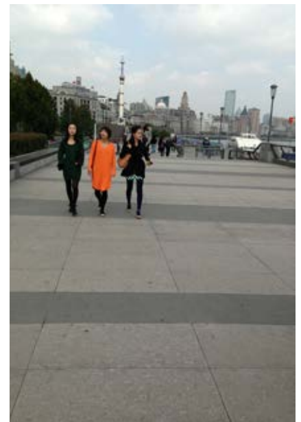
Figure 6: The Bund Promenade at Huangpu River in Shanghai.