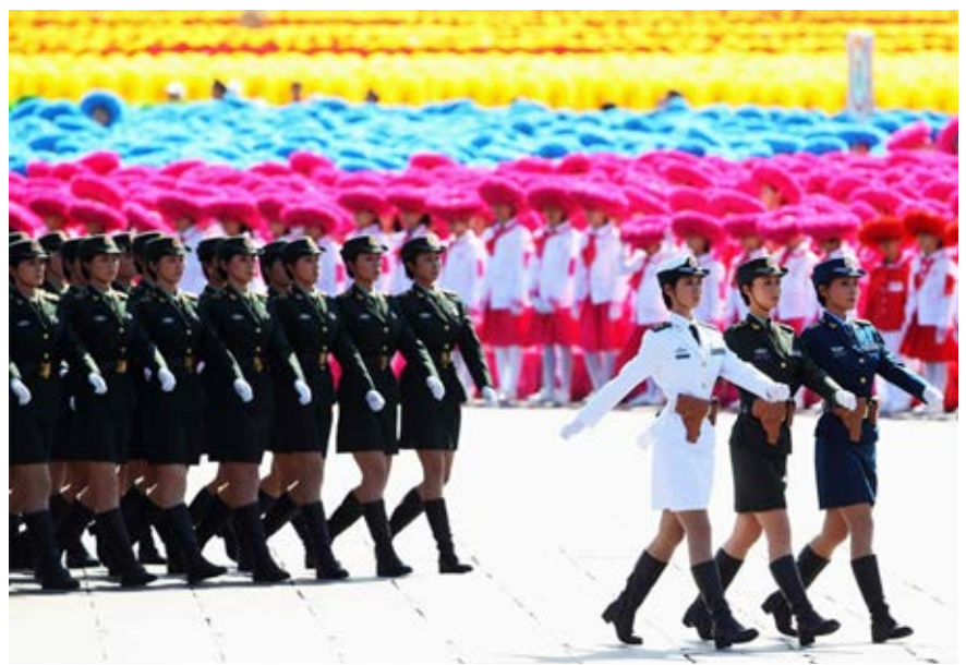
Slika 2: Parada na Trgu nebeškega miru ob 60. obletnici ustanovitve Ljudske republike Kitajske. Vir: Feng Li/Getty Images. ( www.boston.com/bigpicture/2009/10/china_celebrates_60_years.html )

Figure 1: Shanghai once cosmopolitan city, today one of the most important economic, financial and communications centers. Source: Špela Hudnik.