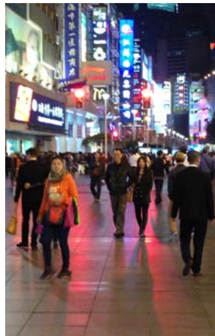
Figure 8: Street Nanjing – a modern Chinese public space in the domain of consumption and entertainment.

Slika 8: Ulica Nanjing – sodobni kitajski javni prostor v domeni potrošnje in zabave.