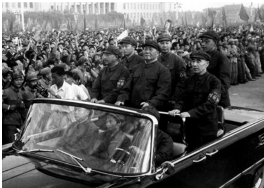
Figure 3: Mao Zedong and Lin Biao on parade at Tiananmen Square during the period of the Cultural Revolution.

Slika 3: Mao Zedong in Lin Biao na sprevedu na Trgu nebeškega miru v obdobju kulturne revolucije.