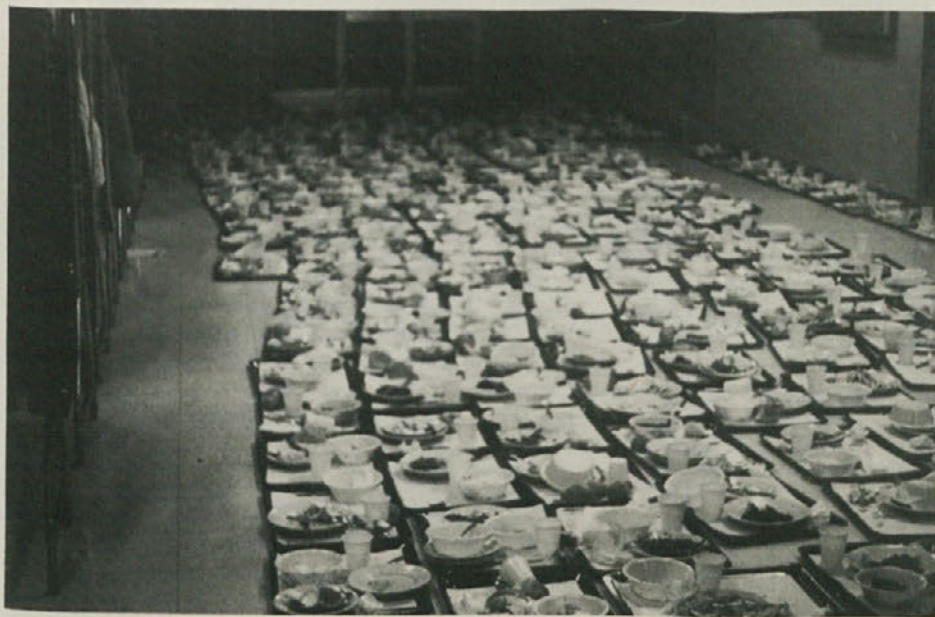
V četrtek 28. januarja so študentje Študentskega doma v Trstu na dokaj originalen način protestirali zaradi nezadovoljive prehrane, ki jo nudi študentska menza. Pladnje so odložili pred vhodna vrata in tako preprečili vhod v menzo.

v sodelovanju z Goriškim muzejem pod pokroviteljstvom OBČINE ŠPETER