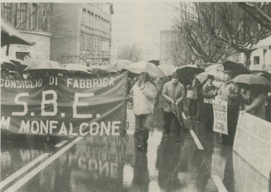
Enotna sindikalna zveza CGIL, UIL in CISL je 21. januarja priredila manifestacijo, da bi opozorila javnost na zahteve delavcev. Drugi dan je namreč na Tržaskem vlesejmu bila Konferenca o državnih udeležbah.

Pri vprašanju za posebne kompetence, ki naj bi bile dane tržaški občini, se je v vsej moči pokazalo izsiljevanje Liste za Trst in drugih tržaških konzervativnih sil. Vsiljeno je bilo mnenje, da omejujejo razvoj Trsta prisotnost in pristojnosti okoliških občin. Kompetence na področju prostorskega načrtovanja in kulturnih dobrin bodo v tem primeru dodeljene občini in ne pokrajini. KPI je bila odločno proti takemu predlogu bodisi zaradi njegovega protislovenskega značaja bodisi zaradi potrebnega soočanja med vsemi tržaškimi krajevnimi upravami.