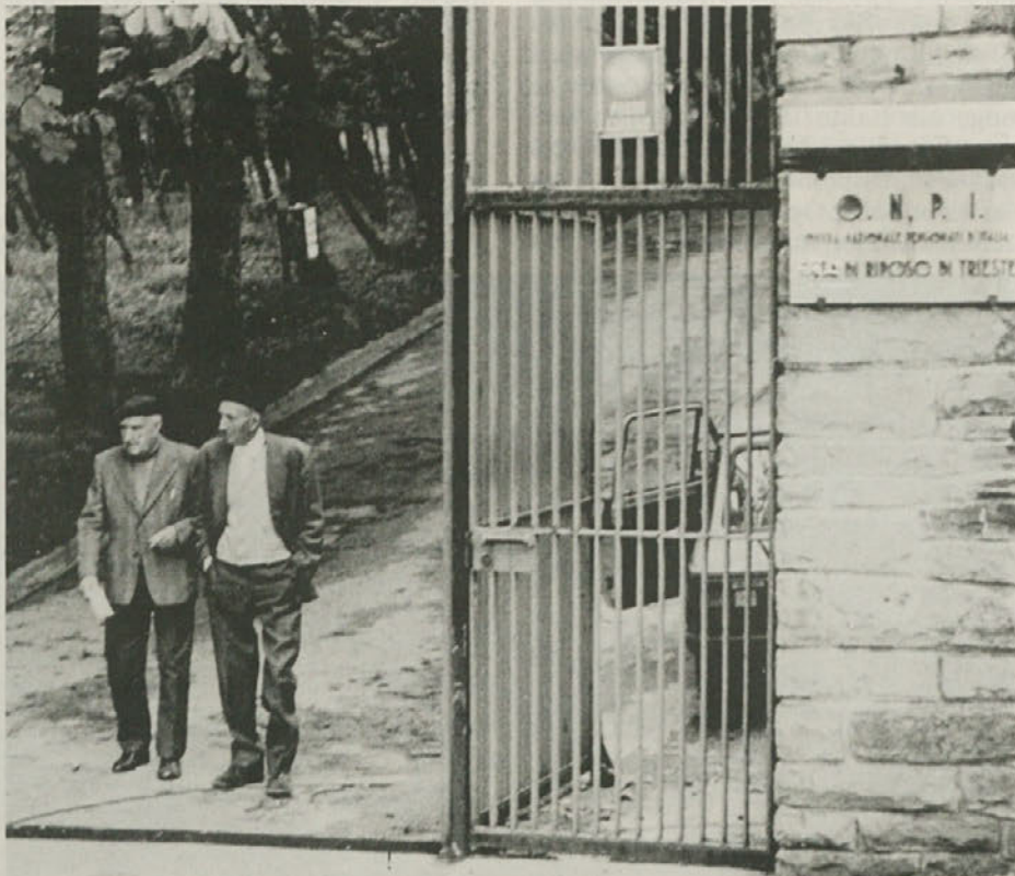
Za drugačno bodočnost Trsta. Pokrajinska programska konferenca KPI (5. in 6. februarja).

Odg.: Predvsem je o tem spregovoril minister Andreotti. Sami smo vztrajali pri vprašanju bremena, ki ga Jugoslavija prenaša zastran napak in krivic mednarodnega gospodarskega in finančnega sistema, kot tudi pri nujnosti ukrepov, ki naj nemudoma razklenjejo klešče rokov in obresti jugoslovanskega zunanega dolga. Vztrajali smo tudi pri potrebi, da se Jugoslaviji odmeri primerno mesto pri italijanskem programu «sodelovanja pri razvoju» s seganjem po prijemih, ki jih predvideva zakon št. 49, všteti prijem podpornega kreditiranja v zaznavni in ustrezni meri.