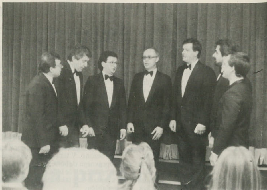
PD Slovenec je v soboto 23. januarja priredilo v nabit polni dvorani Srenjske hiše v Borštu koncert Tržaškega okteta.

Te razmere kažejo, da je izrednega pomena pobuda, kot je «Ženska listina», ali «karta», ki jo je pred nedavnem odobrila KPI za ženske in ki jo predlaga v razmišljanje vseh žensk v Italiji, ampak tudi žensk v emigraciji in žensk drugih držav. «Karta» naleteva že na veliko odobravanje in zanimanje v vseh ženskih krogih in more postati učinkovito sredstvo za pobude in povezavo z drugimi ženskimi gibanji v Evropi.