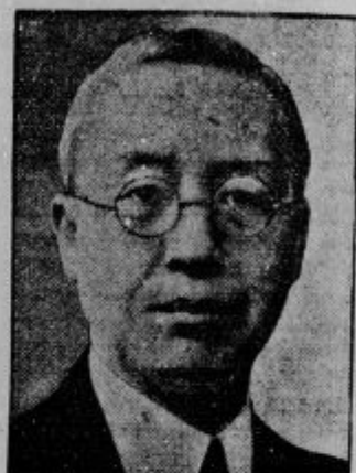
Dr. Syngman Rhee, predsednik »provizorične« rodne vlade korejske, ki se nahaja v pregnanstvu je nastopil v Zenevi pri Zvezi narodov z veččlansko delegacijo z ostrim protestom proti Japoncem, ki imajo v posesti njihovo dediščino, Korejo.