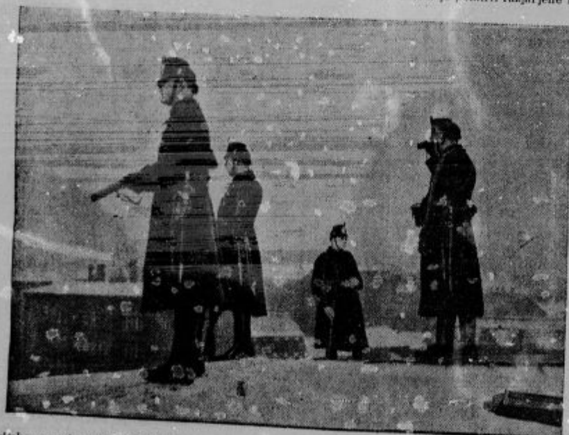
Policijska postaja na strehi. Med koncertom S. A. na Brillowem trgu v Berlinu (kjer se dogajajo največje nemiri in krvava nasprotstva) opazujejo berlinski policisti s strehe, da se ne bi kje pojavil nered. V rokah imajo sredstva za »pomirjenje«