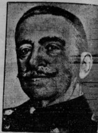
Zadnji španski ministrski predsednik iz monarhične dobe, admiral Aznar, je te dni umrl.