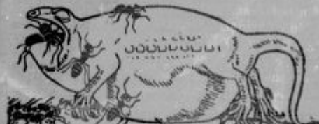
Pa se jih je nazobal tok'