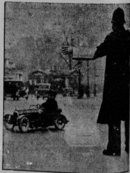
Liliputanski avtomobil. V največji prometni vrvež v Hyde parku v Londonu je zavozi malčič, radi katerega je moral službujoči policist ustaviti ves avtomobilski promet, da se je mali vozač mogel brez nevarnosti odpeljati na prejšnjem avtomobilu.