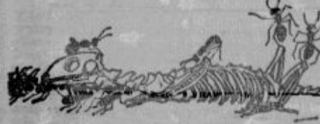
Da je nazadnje reko: pok!