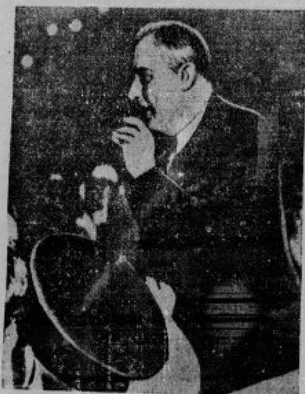
Minuta po atentatu v Miami. Roosevelt je zaklical: 'Nisem zadet! S tem je pomiril razjarjene množice.'