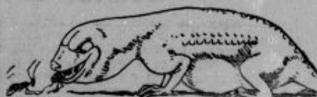
Ki črne mravlje je lovil