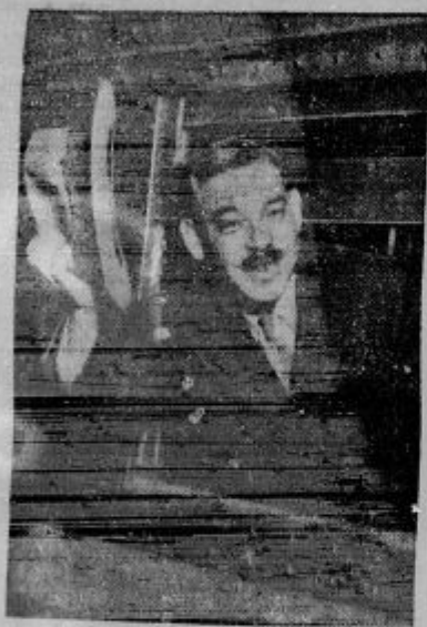
Matsuoka, japonski delegat v Zvezi narodov. 'Z Bogom, Zencva?'