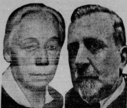
Pomemben odstop iz pruske akademije umetnosti, Käthe Kolwitz, velika umetnica v grafiki in Heinrich Mann, znani romanopisec, sta izstopila iz pruske akademije umetnosti. Ozadje, ki je vsakakor političnega značaja, ni pojasnjeno.