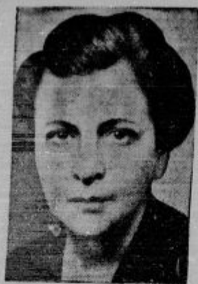
Za ministra dela je predsednik Roosevelt določil gospo Frances Perkins. To je prva ministrica v zgodovini Združenih držav