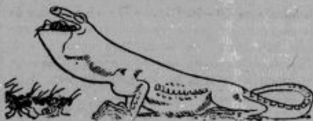
Enkrat je en kuščar bil