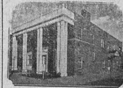
Zakrajsek Funeral Home, Inc. 6016 ST. CLAIR AVENUE Tel: ENdicott 1-3113